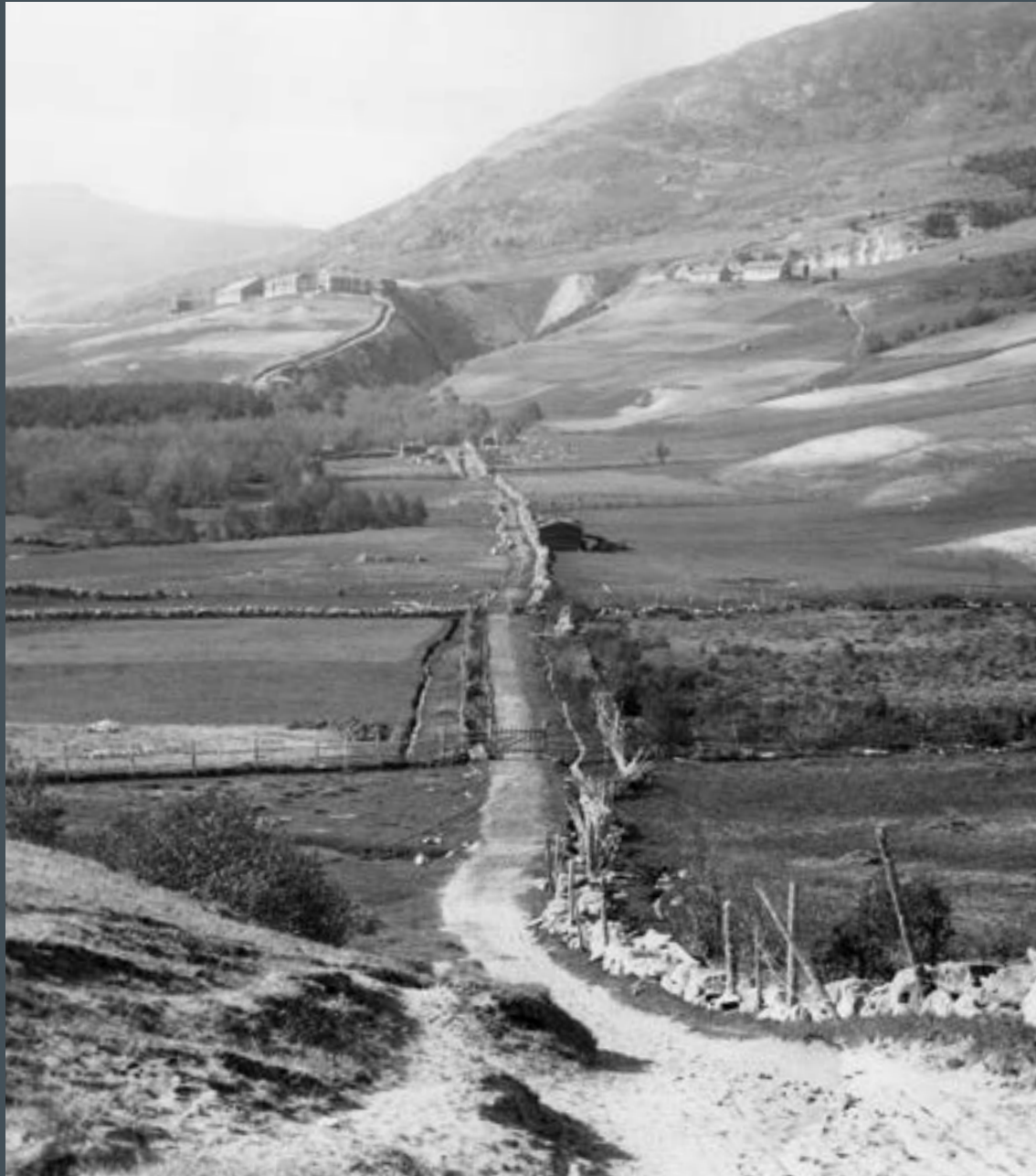
Kongevegen gjennom Dovrebygda til gården Tofte. Bildet er tatt på slutten av 1800-tallet.