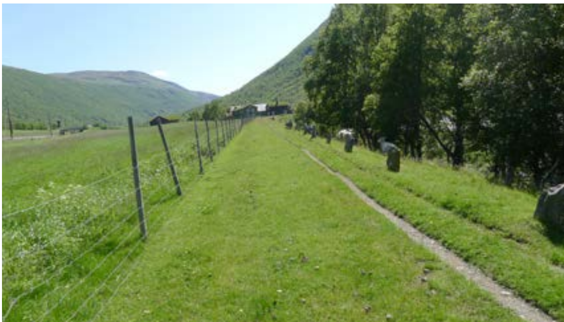
Kongevegen med Drivstua i bakgrunnen.

gammel bruovergang bak hovedhuset på Hjerkinns og rester etter kongevegens vegfundament inn mot tunet i sør. Hjerkinns har vært et sentralt sted, og er nevnt i kilder fra 1100-tallet. 10 Det har også vært et gammelt kirkested på Hjerkinns, og tuften etter kirken kan vi antagelig se rester etter ved kongevegen sør for Hjerkinns og Foll-dalsvegen. 11