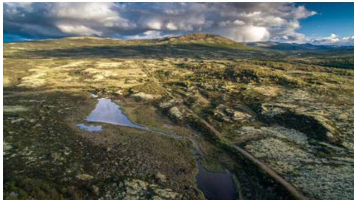
Kongevegen over Hjerkinnhø.

Fremdeles kan vi se kongevegen som strekker seg inn mot tunet fra sør og videre nordover fra den nordre siden av tunet. På grunn av nye veger, er det lite igjen av kongevegen mellom Fokstua og Dovregubbens hall, men enkelte steder kan vi likevel finne små bruddstykker av