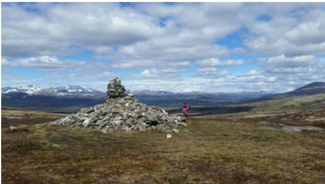
Utsikt innover Dovrefjell fra Allmannrøysa. Kongevegen kan skimtes til høyre for røysa.

den Budsjord, som er et godt bevart tun med 18 fredete bygninger fra perioden 1750 til 1850. Budsjord er nevnt i skriftlige kilder fra 1400-tallet, og var et kirkegods i middelalderen. Gården var underlagt biskopene i Nidaros og Hamar, og antagelig er navnet Budsjord en avledning av «biskopsjord». 8