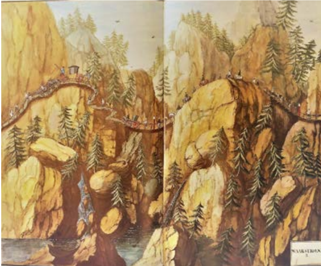
Jacob Fosie tegnet flere akvareller fra Christian VI's kongeferd i 1733 (Kierulf 1960)

anlagt på slutten av 1600-tallet og begynnelsen av 1700-tallet, og med dette fikk fjellovergangen over Dovrefjell en kjørbær veg for hest og vogn som var anlagt etter datidens krav om oppbygget veglegeme, forbedret vegdekke og plikt om vedlikehold. 1 Det er imidlertid begrenset kunnskap om når kongevegen ble bygget og hvem som stod ansvarlig for anleggelsen, men beskrivelser av kongeferdene på 1600- og 1700-tallet gir viktig informasjon om oppgraderingen av vegstandard over Dovrefjell.