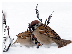
Pilfink Passer montanus