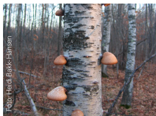
Kjaker på tre