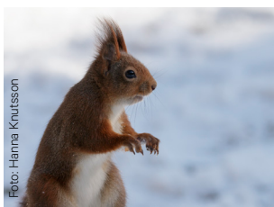
Ekorn Sciurus vulgaris