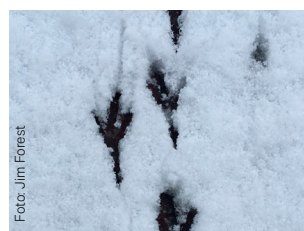
Spor i snøen