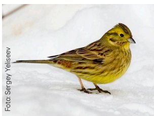
Gulspurv Emberiza citrinella