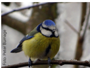
Blåmeis Cyanistes caeruleus