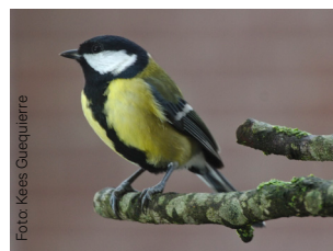
Kjøttmeis Parus major