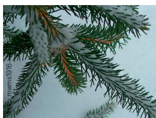
Gran Picea abies