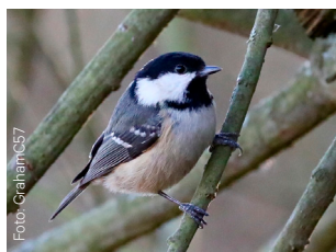
Svartmeis Pariparus ater