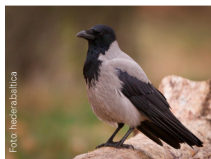
Kråke Corvus cornix