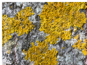
Messinglav Xanthoria parietina