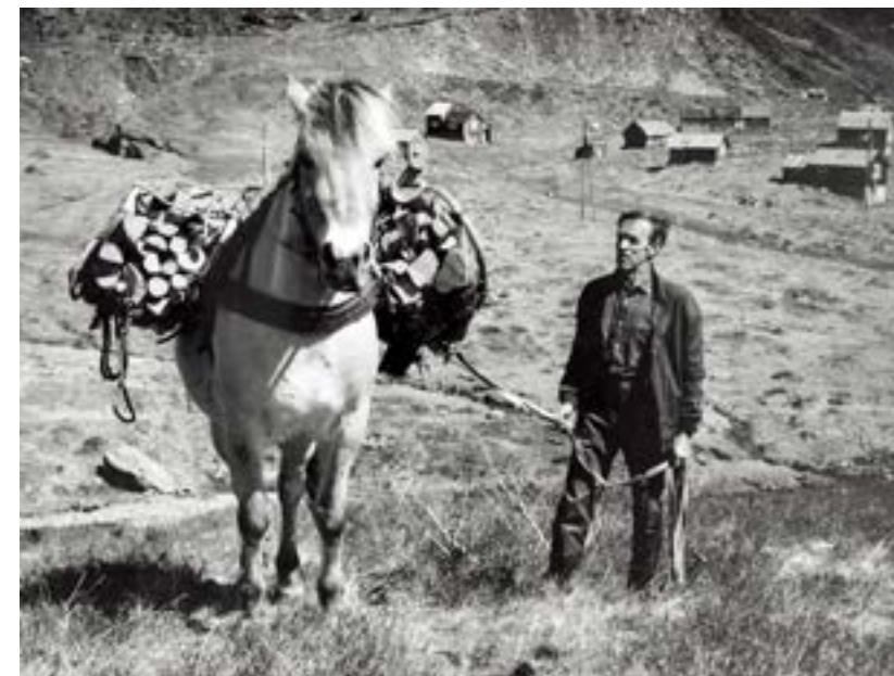
Kløvhest i Myrkedalen, Voss. Kløv var den vanlege transportmåten sommarstid i heile Norge rundt 1740. På Vestlandet var det ikkje lagt an på å byggje køyrevegar før rundt 40-50 år seinare.