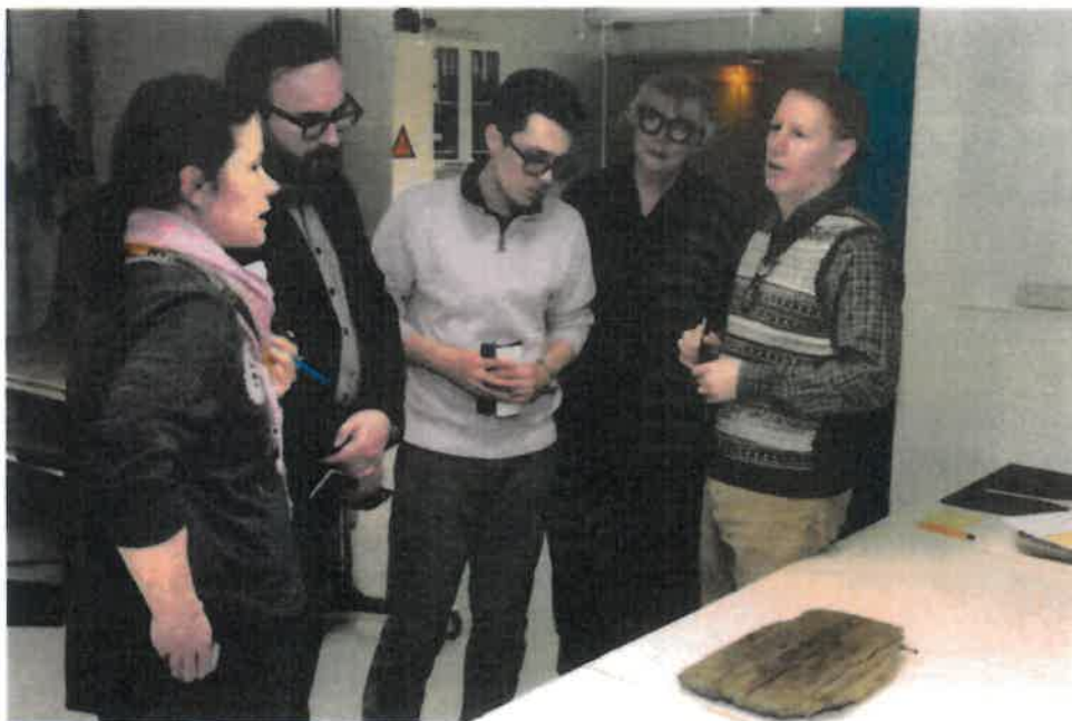
Den russiske generalkonsulen i Barentsburg Sergej Gusjtsjin besøkte Svalbard museum i mars 2019.