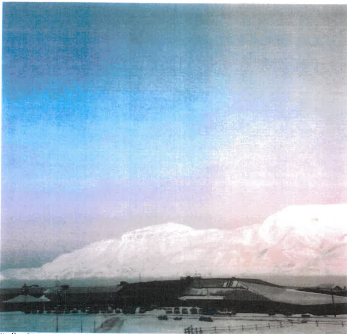
Svalbard Museum er lokalisert i Svalbard Forskningspark.

Museet er lokalisert i Svalbard Forskningspark og inngår som en del av Svalbardporten. Fra 2011 overtok Stiftelsen Svalbard Museum ansvaret og driften av Sysselmannens kulturhistoriske magasin som har vært samlokalisert med Svalbard Museum i Svalbard Forskningspark siden 2005. Sysselmannens kulturhistoriske magasin er derfor historie og Svalbard Museum er utvidet med en hel etasje i D – fløya i Svalbard Forskningspark. Utvidelsen omfatter et klimaregulert gjenstands- og fotomagasin, tørr- og våtlaboratorium, samt to kontorer. Det fulgte en stillingshjemmel (konservator) med overførselen fra SMS.