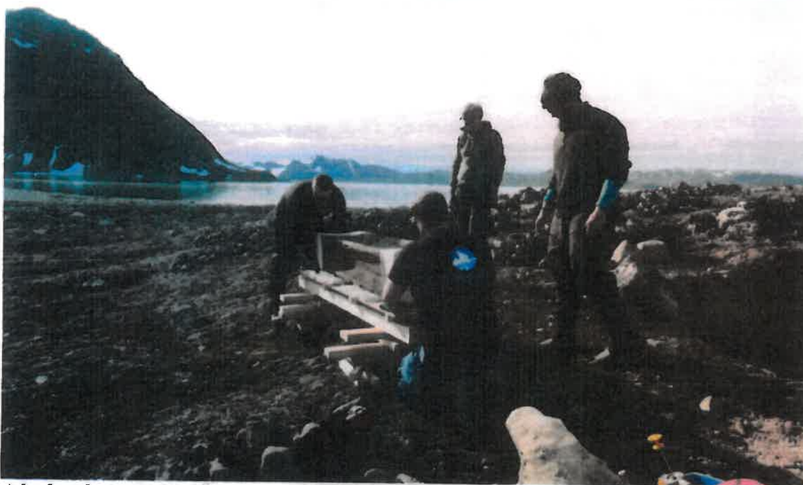
Arkeologisk utgravning Likneset august 2019.