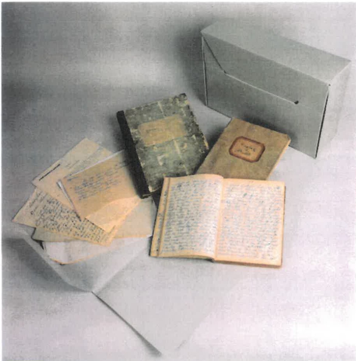
Fangst dagbøker, hyttebøker og brev fra vårt arkiv.