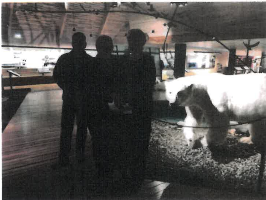
Kulturminister Trine Skei Grande besøkte Svalbards museum 28. september 2019.