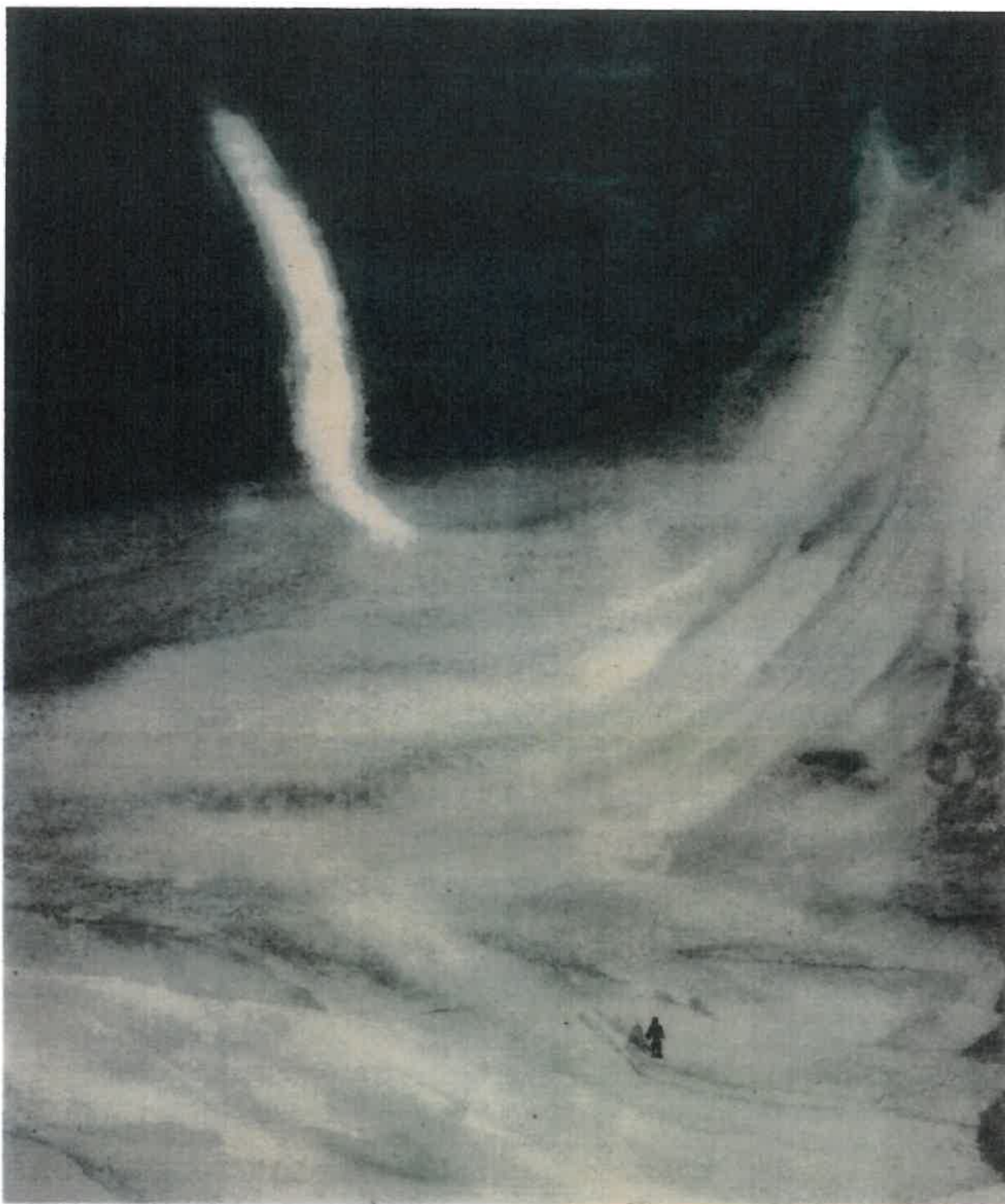
Akvarell fra Gråhukuken av Christiane Ritter fra 1934/1935. En av 34 akvareller gitt i gave til Svalbard Museum.