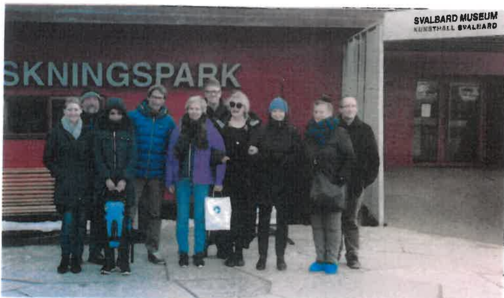
Nasjonalt utvalg for forskning på menneskelige levninger «Skjelettutvalget» hadde utvalgsmøte på Svalbard museum i mai 2019.