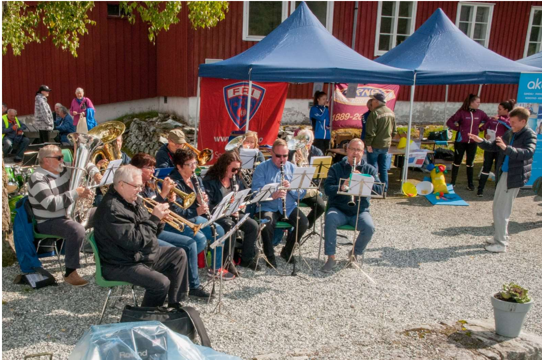
Familedagen «Aktiv i Arna», 26. august, ble en stor suksess.

3. desember: Juleavslutning med middag i Espeland fangeleir i regi av venneforeningen.