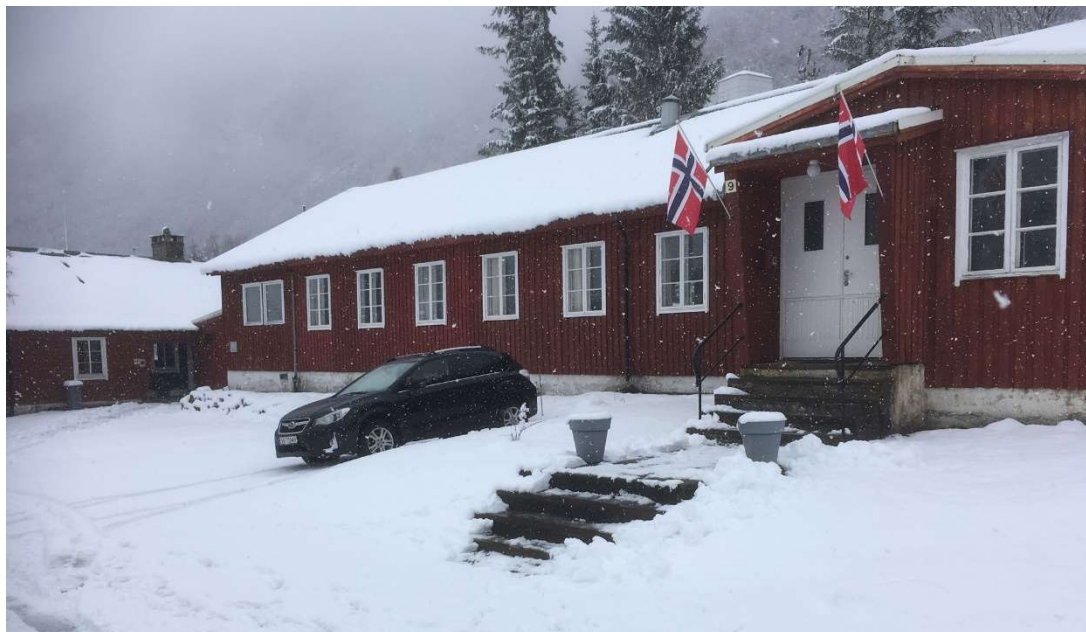
Kvinnebrakken klar for innrykk, til tross for været.

Styret har en aktiv deltakelse i driften. Arbeidsmiljøet anses som godt.