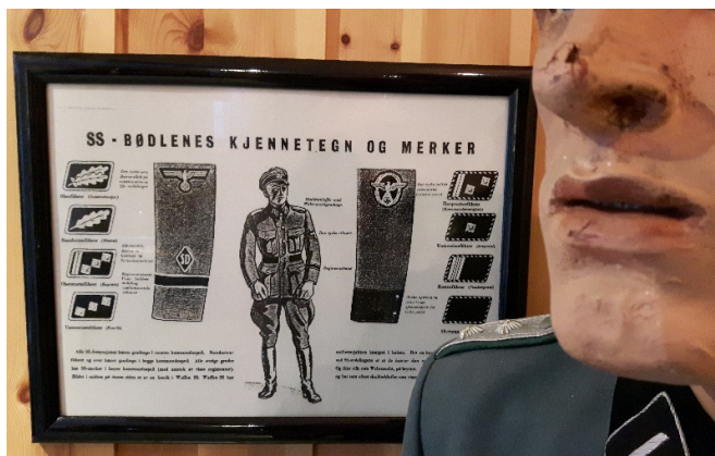
Forakten for menneskerettighetene antar nye kjennetegn i vår egen tid.

Utover dette ønsker stiftelsen å bygge opp et kompetansesenter bestående av to deler: en omfattende kursvirksomhet i hovedsak rettet mot lærerne, og en forskningsinstitusjon, begge knyttet til formidling av menneskerettigheter i skolen.