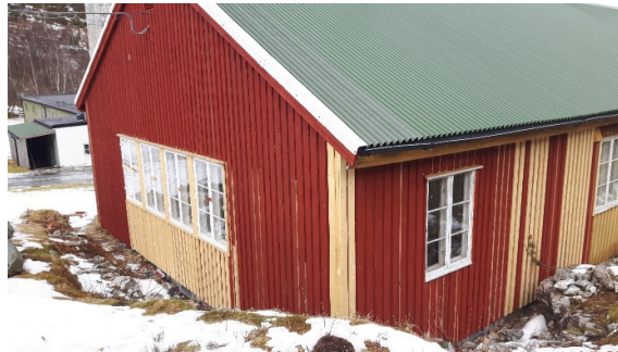
Store arbeider er nedlagt på Kvinnebrakken.