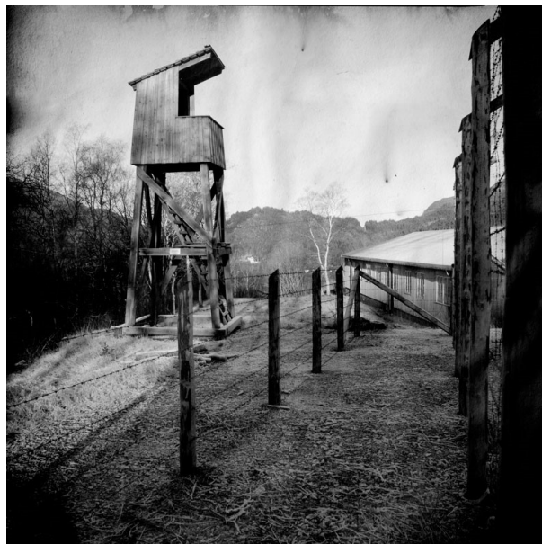
Espeland fangeleir.

Espeland fangeleir, syd for Indre Arna i Bergen kommune, er det eneste gjenværende, helhetlige anlegget av nazistenes flere hundre fangeleirer i Norge fra 2. verdenskrig – og er i sitt slag antakelig også den best bevarte i hele Europa! Veien til leiren ble bygget av jugoslaviske slavearbeidere. Fra 1943 ble den, ennå uferdig, tatt i bruk som transittleir for politiske fanger og motstandsfolk, med plass for 380 innsatte.