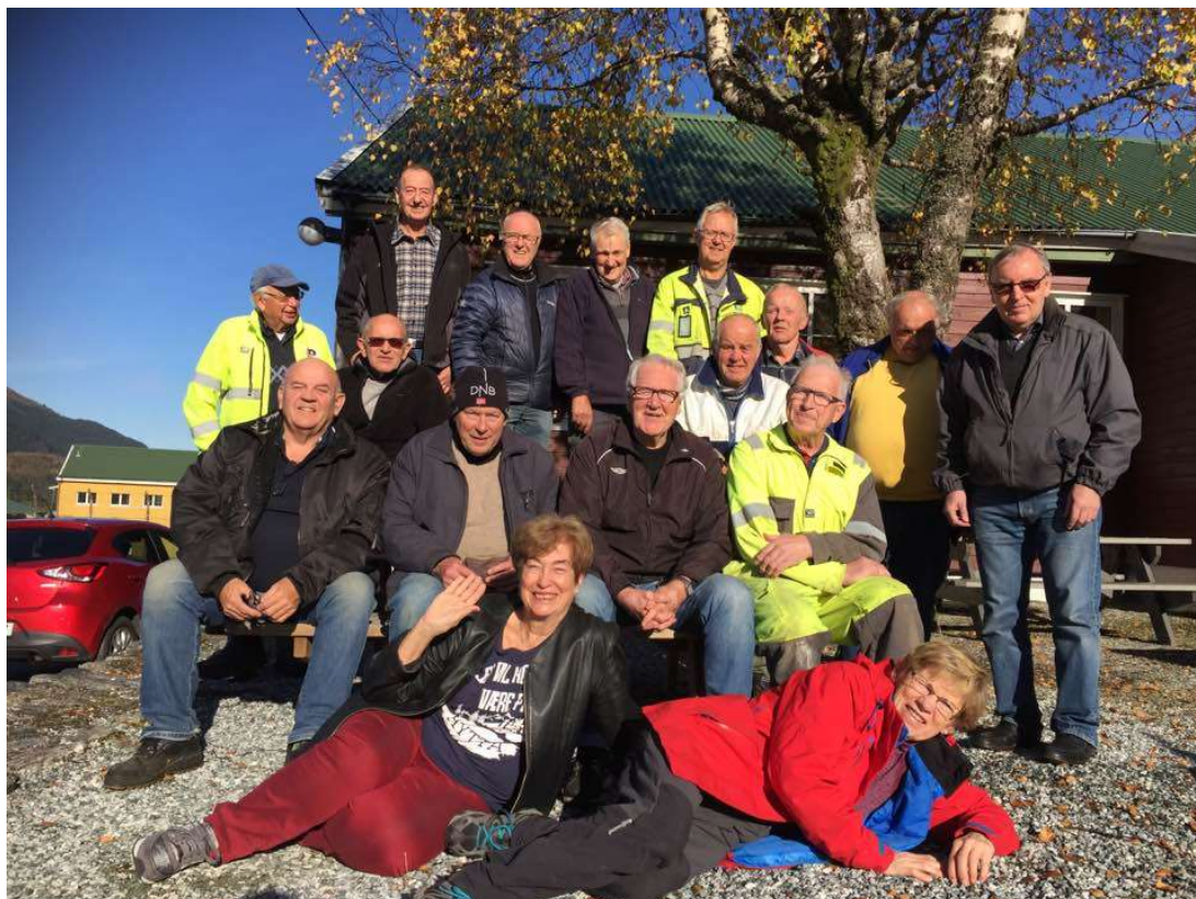
En stor takk til våre frivillige! Her noen av dem.