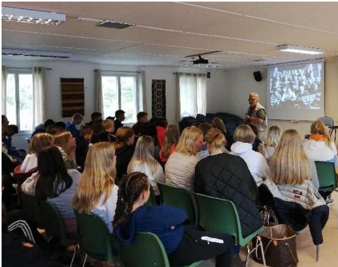
Skolegruppen har vært spesielt aktiv, og antall skolebesøk har skutt i været.

I tillegg kommer en utstrakt møtevirksomhet, eksterne foredrag, venneforeningens dugnadsarbeid, forarbeider til undervisningsoppleggene, søknadsarbeid, utleie av lokaler, og samarbeid med vernemyndigheter og entreprenører for ivaretagelse av det fredede anlegget. Stiftelsen har også vært i mange møter av ulik karakter med Fylkeskonservatoren gjennom året; dette samarbeidet har vært godt, om enn vi erfarer en viss sendrektighet i etaten.