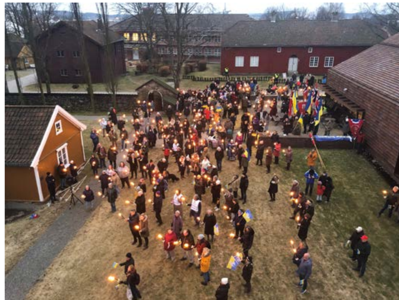
Tårnet på Borgarsyssel Museum ble lysatt i de ukrainske fargene, og friluftsmuseet var samlingssted for fakkeltog som gikk til sentrum av Sarpsborg.

Hege Hauge Tofte Direktør, Østfoldmuseene