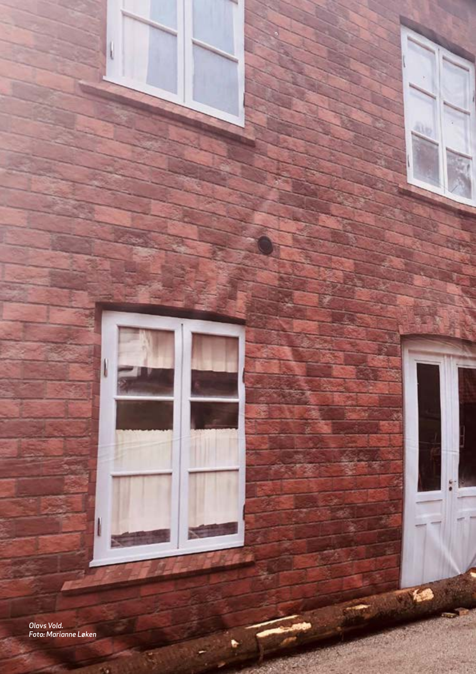
Olavs Vold.