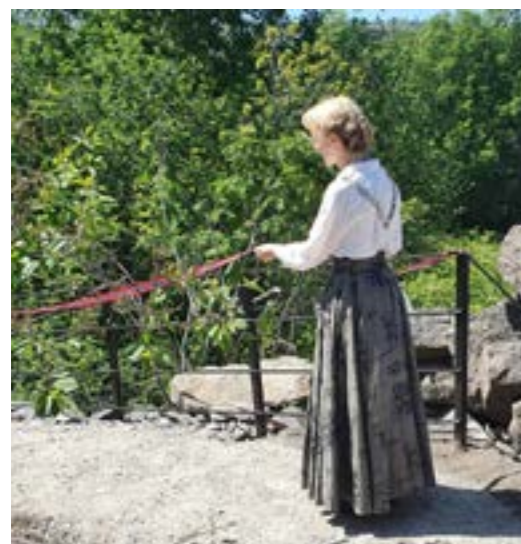
Åpning av veien til Brottet..