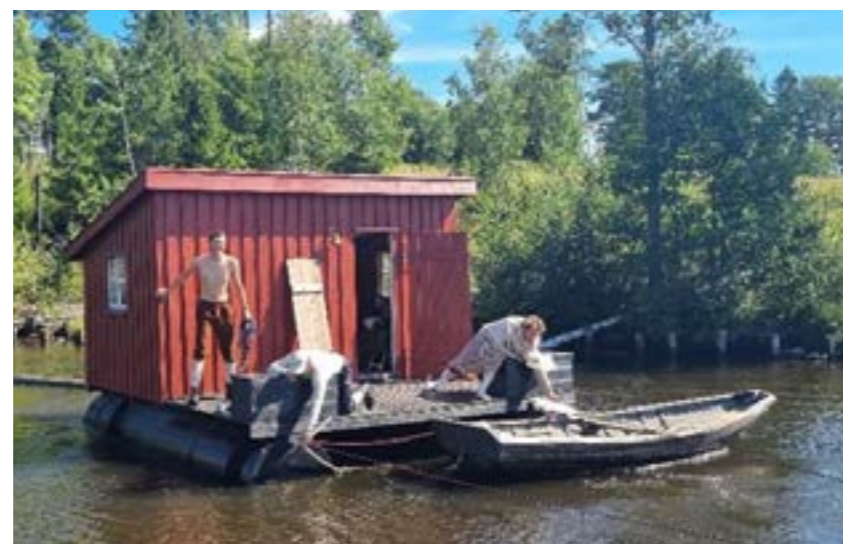
I forbindelse med prosjektet «Mannen og kråka» ønsket Vadmelsbanden å låne fløterhytta. Kompaniet ønsket å «seile» på hytta gjennom Haldenvass- draget fra Skulderud til Tangen i Tistedal, mens det ble filmet korte snutter som skulle inngå i utstillingen/forestillingen deres.