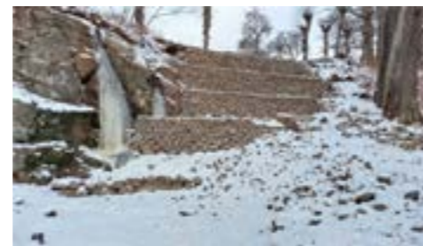
1. Tørrmurer i Rødsparken.