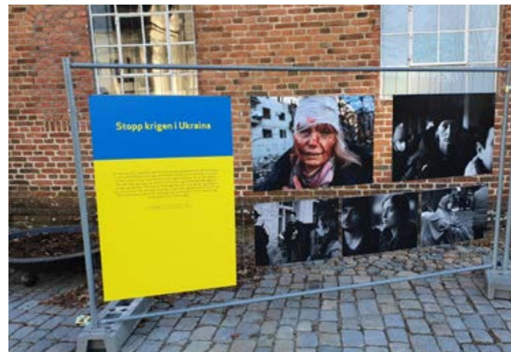
Hot-spot Ukraina. Utstillingen ble montert utendørs 9. april utenfor museet i Tøihuset i Gamlebyen.