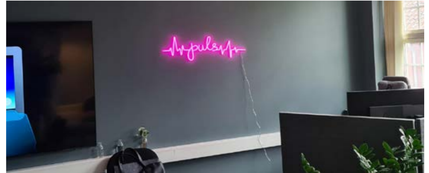
PULS-kontoret ble pusset opp.