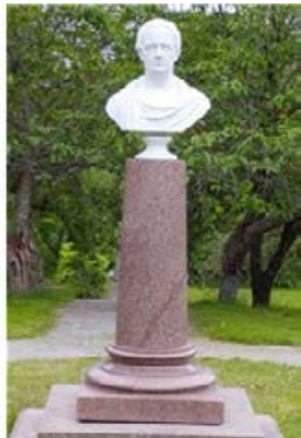
1. Byste i Rødsparken.