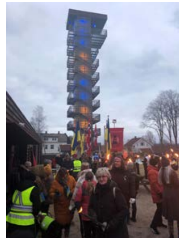
Tårnet på Borgarsyssel Museum ble lyssatt i de ukrainske fargene, og friluftsmuseet var samlingssted for fakkeltog som gikk til sen- trum av Sarpsborg. . Foto: Marianne Løken.