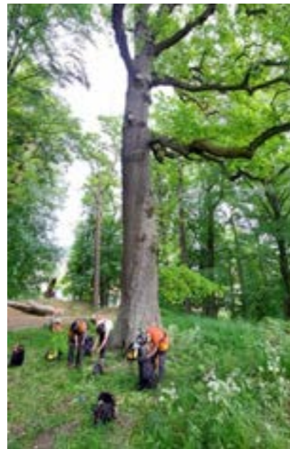
2. Trefelling i Rødsparken.