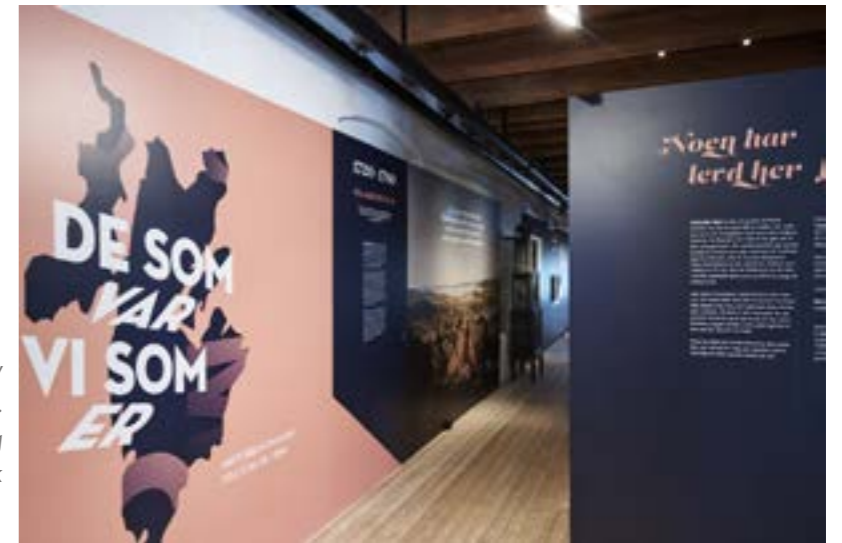
16. juni åpnet museet DEL 1 av utstillingen DE SOM VAR, VI SOM ER.

Kanalmuseet har i løpet av året vært i dialog med blant annet Naturhistorisk museum Oslo og ANNO Norsk skogmuseum om mulige fremtidige prosjektsamarbeid. I tillegg har museet samarbeidet med lokale aktører om ulike arrangement gjennom året.