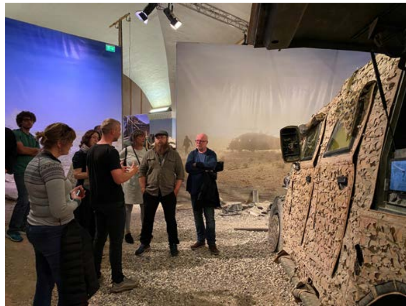
Studietur til København. Her på Krigsmuseet.

Fysiske møter er svært viktige i en organisasjon som jobber så desentralisert som Østfoldmuseene. I tillegg til møter direkte knyttet til faglig samhandling på tvers i organisasjonen har alle ansatte hatt anledning til å komme sammen sosialt på sommerfest og julelunsj i Fredrikshald teater. I september arrangerte museet studietur til København med faglig godt gjennomarbeidet program og god oppslutning.