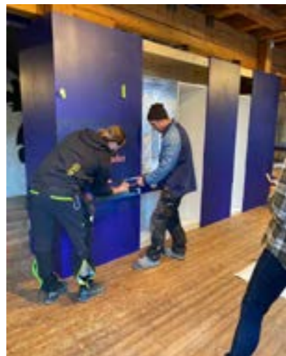
16. juni åpnet museet DEL 1 av utstillingen DE SOM VAR, VI SOM ER.