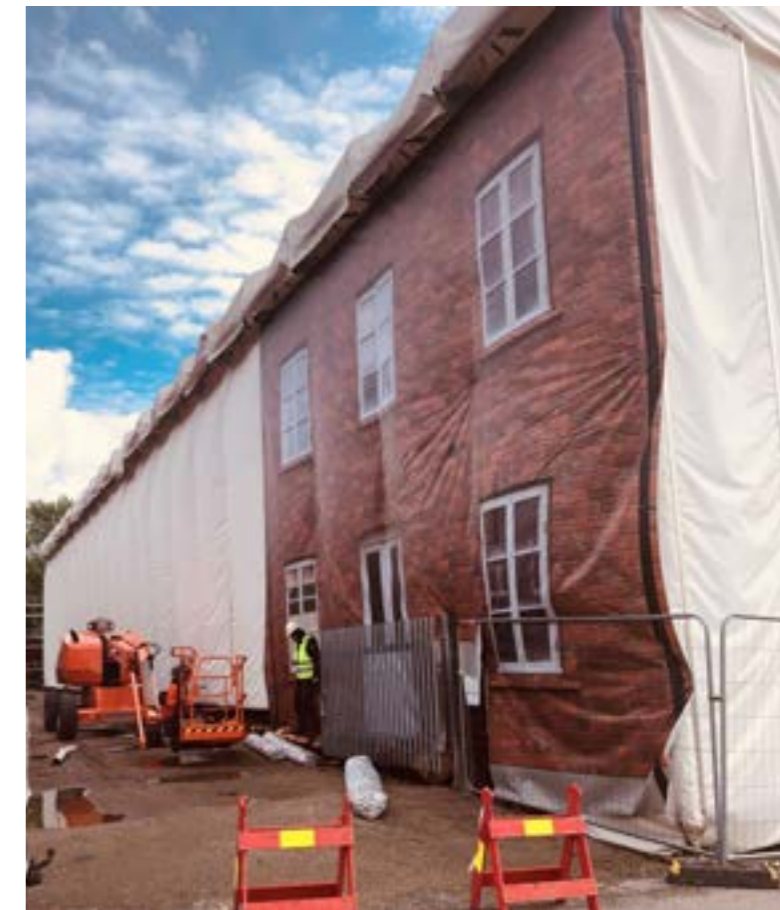
Prosjektet med tittelen SarpeDiemUng knyttes til kommunens område- satsning og til museets konseptuelle utvikling rundt arbeiderbrakkka St Olavs Vold. Ungdommene bidrar både som informanter, medforskere og produsenter og de skal vise filmen på et lerret som er strukket som del av fasadebekledningen rundt stillasene som er sett opp rundt St Olavs Vold i forbindelse med rehabiliteringen.