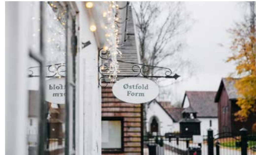
Nytt av året var vår egen julebutikk i Østfold Form på Borgarsyssel som var godt besøkt og hadde god omsetning.