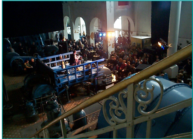
Første konsert i freda bygg med bluesartisten Bjørn Berge i 2000