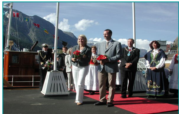
Kronprinsparet på besøk i 2002