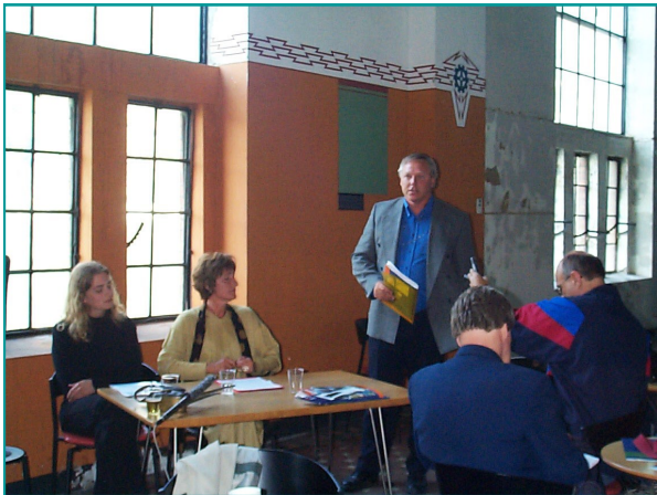
Riksantikvarens offisielle fredning av kraftstasjonen i 2000