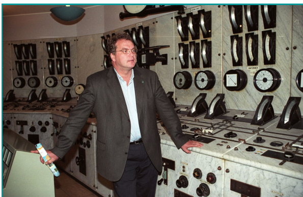
Den gang landbruksminister Lars Sponheim på besøk i 2001