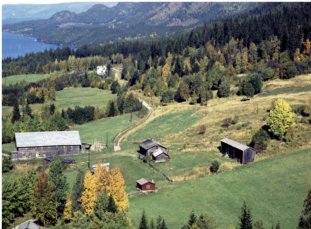
Garden Andrå. Flyfoto fra 1961, vel hundre år etter den triste hendelsen der. MINØ.015348.

beide.» Han kom å tukthuset 6.6.1857 og i botsfengselet 15.7.1858 på 1 år, 11 måneder og 4 dager. Skal løslates 19.6.1860. Semning prata nok en del med sogneprest Bull og det oppgis at han er født 1.11.1805, døpt 24.11.1805, konfirmert 1820. Videre skrives «Hvad hans moralske forhold angaaer, da