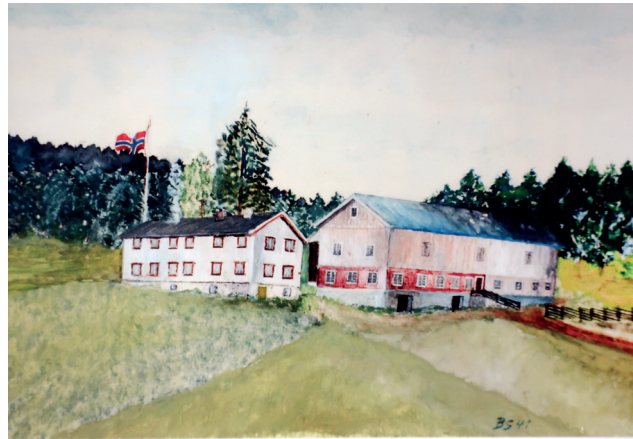
Tegning av Skågset i 1941 med våningshuset fra 1870-tallet og låven bygd i 1937. Disse ble revet på 1950-tallet da gardstunet ble flyttet nærmere hovedvegen. Tegnet av Bjarne Skogseth.

Trondheim, kom videre til Bjugn i Fosen, før han bosatte seg på Frosta, og ble stam-