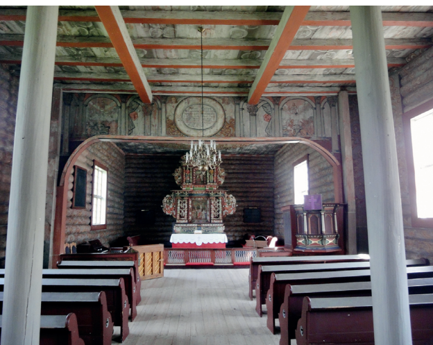
Interiør i Tyllaldalen kirke i 2014.