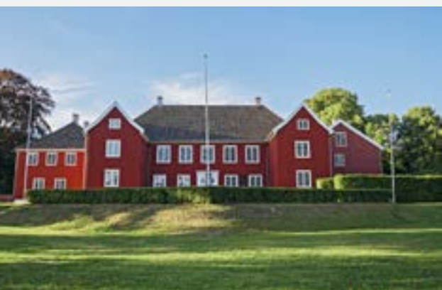
Herregården i kveldssol.