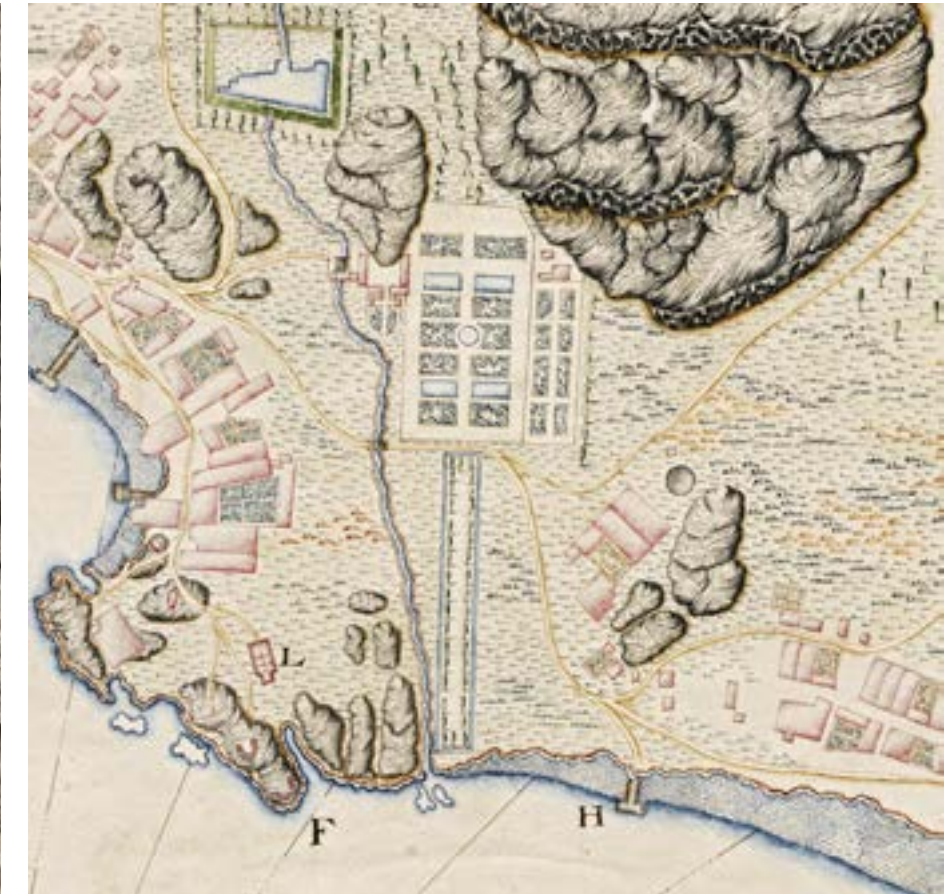
Utsnitt med herregårdsanlegget fra ingeniørkaptein Peter Jacob Wilsters kart fra ca. 1690. Ill.: Riksarkivet

Foto: Aleksander V. Oxholm/Vestfoldmuseene