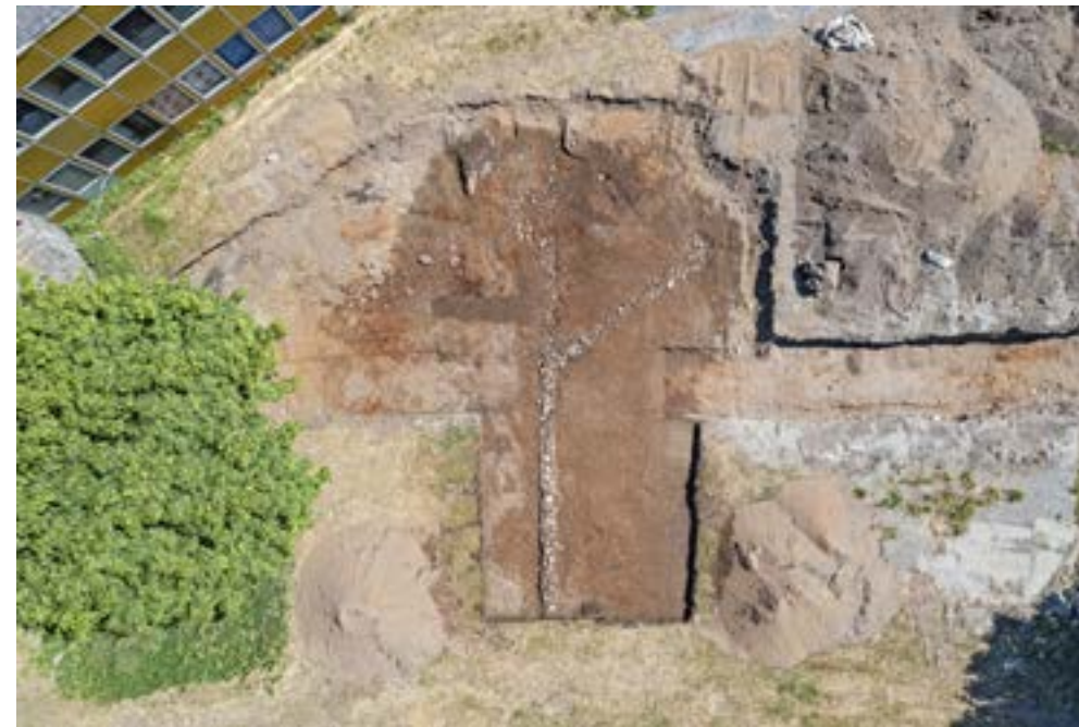
Dronefoto over dreneringsgrøften. Til venstre for grøften skimtes sirkelformede plantegroper. Øverst i venstre billedkant synes skoletilbygget fra 1960-tallet.

I løpet av noen dager hadde teamet gravd seg helt frem til nordenden av fundamentet. Den lengste muren målte 12 meter.