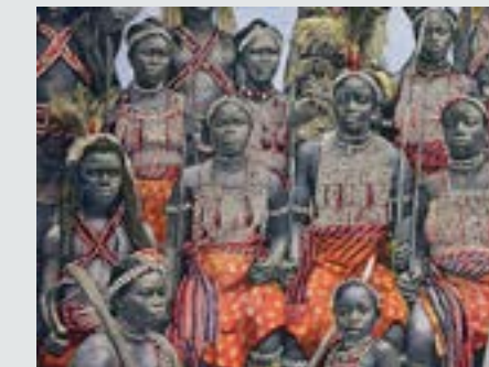
Amasonehæren gikk i oppløsning etter at Dahomey ble fransk protektorat i 1894.

1892: Amasonehæren i det afrikanske kongedømmet Dahomey utkjemper sitt siste slag. Kvinnehæren skal ha blitt opprettet på 1600-tallet, da den mannlige befolkningen skrumpet drastisk på grunn av stadige feider med naborikene. De kvinnelige krigerne får samme militære opplæring som menn og er bevæpnet med macheter og (etter hvert) musketter. På det meste skal hæren ha talt ca. 6000 krigere. I det siste slaget møter de en fransk invasionsstyrke. Selv franske offiserer berømmer kvinnene for deres «ekstreme tapperhet» og «enestående mot» i kamp.