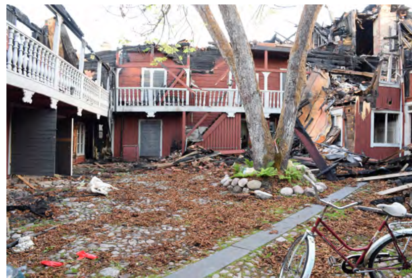
Figur 30: Gårdsrommet før rivingsarbeidene startet. For å beskytte stenleggingen ble det lagt markduk og et relativt tykt bærelag av grus.