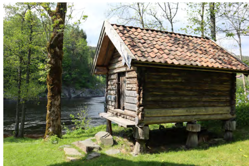
Figur 7: Stabbur fra 1600-tallet ligger langs det uregulerte vassdraget Tovdalselva i Kristiansand kommune.

Opprettelsen av Kunnskapsbanken er en tjeneste som er definert gjennom Kunnskapsbankforskriften 2022. Tjenesten driftes av DSB og sammenstiller relevante risikodata fra NVE, Norsk Klimaservicesenter, Statens vegvesen og forsikringsselskap, inkludert data over forsikringsutbetalinger. Tjenesten er for tiden stengt og