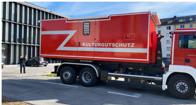
Figur 24: Beredskapscontainer som driftes av Köln Notfallverbund. Ytterligere ti containere planlegges nå for å forsterke beredskapen på kulturarv i Tyskland.

Les mer og se modulene for undervisning her: Verdiberging - undervisningsmaterieell (rvr.no)