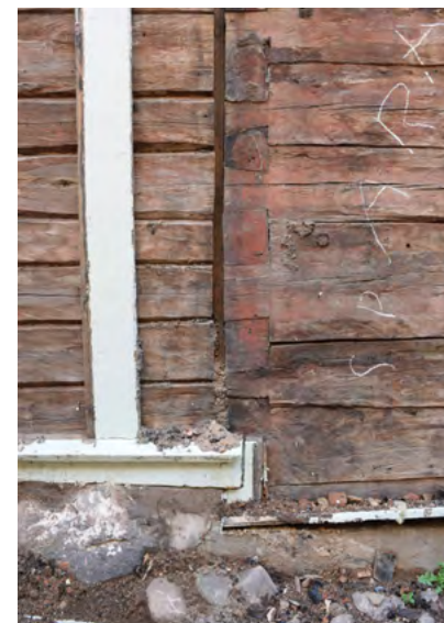
Figur 29: Skjøte mellom to bygningskropper.

Les mer her: Dokumentation efter branden i Eksjö (jonkopingslans-museum.se) . Det finnes også en video med beskrivelse av brann-tomten med dokumentasjonen i etterkant her: Forssellska Gården. Ciselören 1 - YouTube .