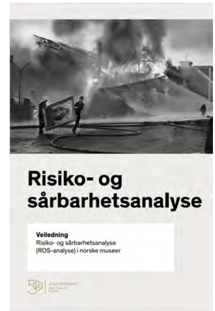
Figur 13: Forside, Kulturdirektoratets veileder.

Veilederens formål er å hjelpe museene med å gjennomføre en ROS-analyse og å bli kjent med eget trusselbilde. Kulturrådet påpeker at en ROS-analyse vil være effektiv for å identifisere og prioritere risikoområder, avklare områder for forbedring og for å planlegge tiltak som kan forhindre eller skape færre risiko- og faremomenter som kan ramme museene.