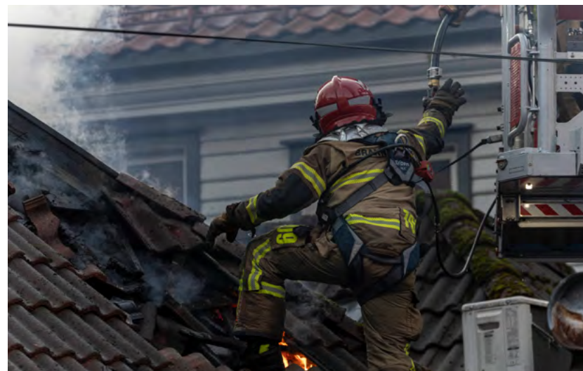
Figur 3: Slokkearbeidet i Bergen sentrum, oktober 2023.

Brannvesenet gis også anledning til å benytte tematilsyn der brannvesenet velger et tema for tilsynsaktiviteten basert på blant annet brannvesenets ROS-analyse. Bruk av lokale prioriteringer vil gjøre at man kan rette tilsynet mot områder man lokalt oppfatter som spesielt risikofylte.