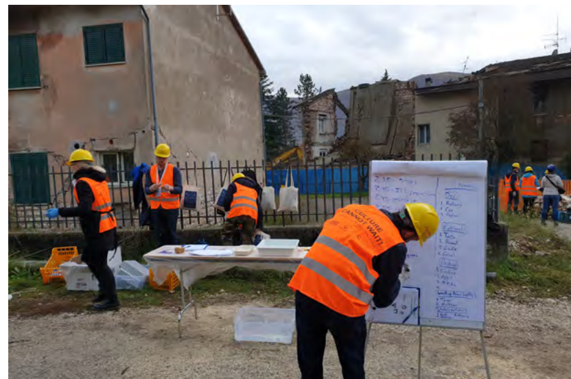
Figur 23: Riksantikvarieämbetet har utrettet grunnlaget for å innføre et nasjonalt kulturvern råd. Bildet er fra en internasjonal øvelse for å håndtere kulturhistoriske objekter ved en katastrofe.

Les mer om arbeidet her: Förutsättningarna för ett nationellt kulturskyddsråd utredna | Riksantikvarieämbetet (raa.se)