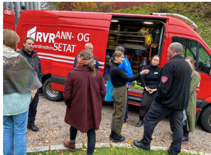
Figur 18: KKOAs er Kriseressurssamarbeid for kulturinstitusjoner i Oslo og Akershus (KKOAs). Fra KKOAs høstseminar 2023.

Du kan lese mer om KKOAs her: Nettsted for samlingsforvaltning (samlingsnett.no)