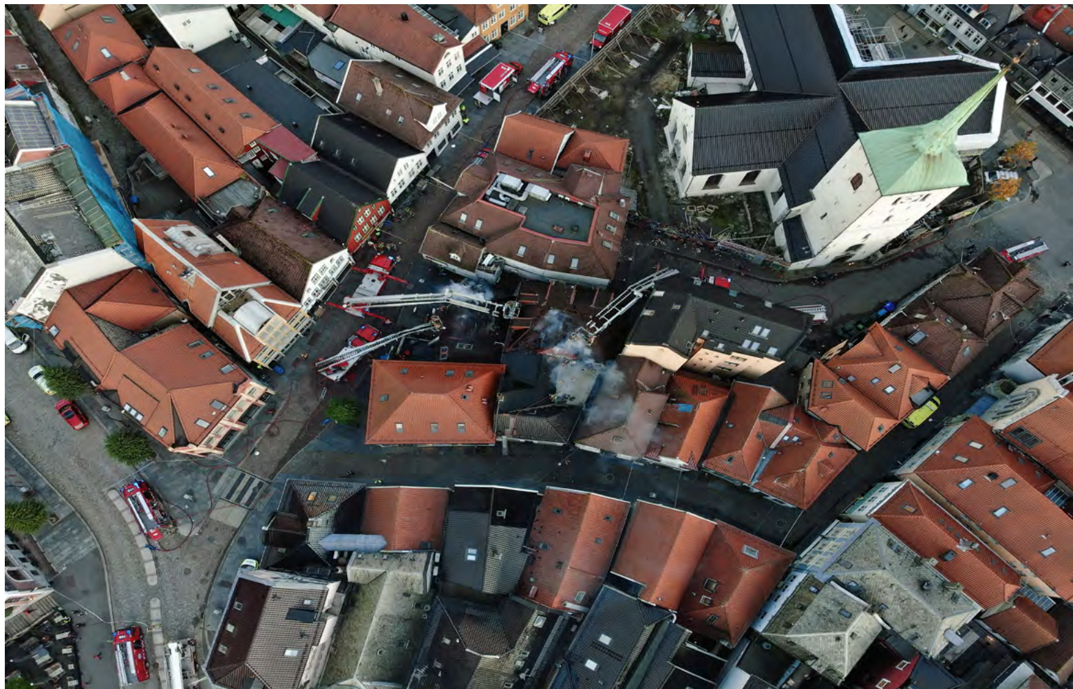
Figur 12: Dronefoto under brannen i Bergen sentrum oktober 2023.

• Hensikten med øvelsen formuleres og forankres hos alle i «spillstaben» (de som planlegger og regisserer øvelsen). Læringen ligger i planleggingsfasen og etterarbeidet, så vel som i gjennomføring av selve øvelsen.