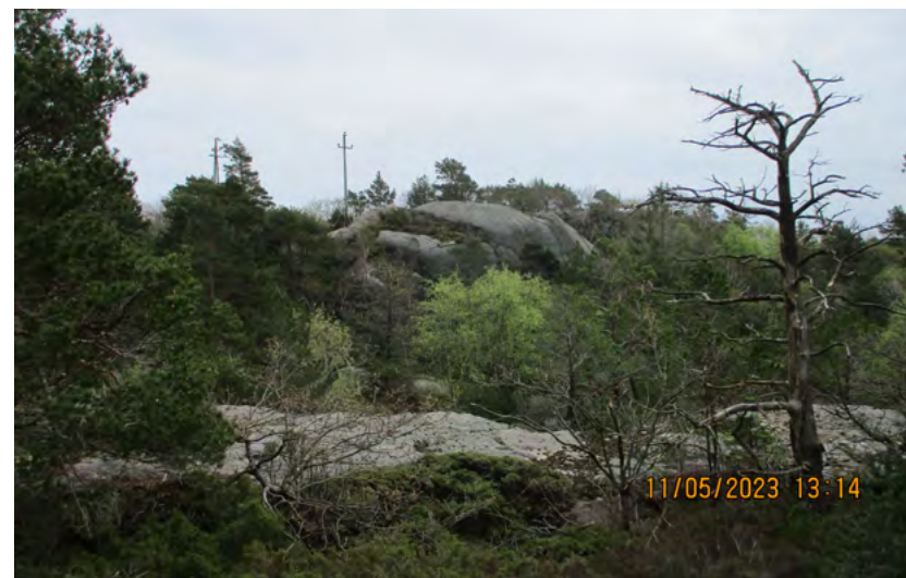
Figur 14: Branngate i landskapet. Foto: Jorunn Monrad, Kristiansand kommune, 2023.

Du kan lese mer om prosjektet her: Kristiansand kommune - Branngater Ny Hellesund