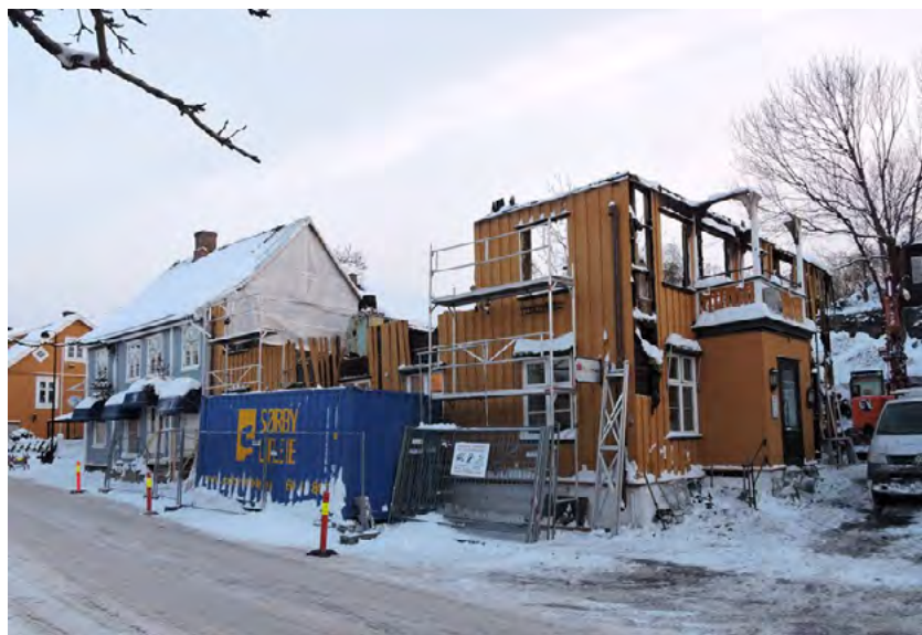
Figur 26: Januar 2016, etter at det gjenværende tømmeret i 2. etasje var merket og demontert.

«Telegrafen» ligger i et område som er regulert til antikvarisk spesialområde bevaring (idag hensynssone), og er en del av Drøbaks tette trehusmiljø. Reguleringssplanen har imidlertid ingen bestemmelser om brann eller hva som kreves ved gjenoppbygging etter en eventuell brann, og eiers holdning ble derfor viktig. I dette tilfellet ønsket eier å gjenoppføre bygningen, identisk med opprinnelig konstruksjon. Forsikrings-selskapet ønsket på sin side riving, de vurderte bygningen som totalskadet, og ønsket oppføring