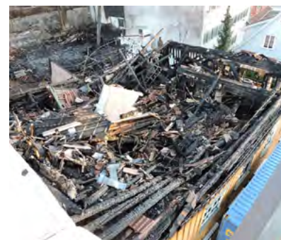
Figur 27: Utbrent takverk og 2. etasje, på Telegraf i Drøbak som brant i 2015.

Etter undersøkelser ble det bestemt at tømmervegger i 1. etasje skulle tas ned, og bygningen fikk restaurert 1. etasje, ny 2. etasje og nytt åstak.