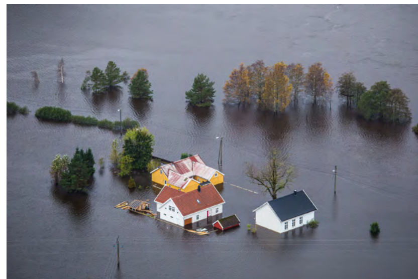
Figur 8: Drangsholt er et boligområde i Kristiansand kommune som blir sterkt berørt når Tovdalselva flommer over. Les mer om dette i kapittel 9.

Etablerte nettverk og «klarerte» kontaktpersoner med kulturminnekompetanse bør kunne bistå etter ferdigstilt innsats for å minske skader på kulturhistoriske verdier. Her er det viktig å få avklart roller og ansvar, og dermed få tilgang til bygningen(e) med følge av politi. Mange tiltak som gjøres rett etter slokking kan begrense skader på bygningskonstruksjon, interiør og inventar. Dokumentasjon er en svært viktig oppgave etter en hendelse.