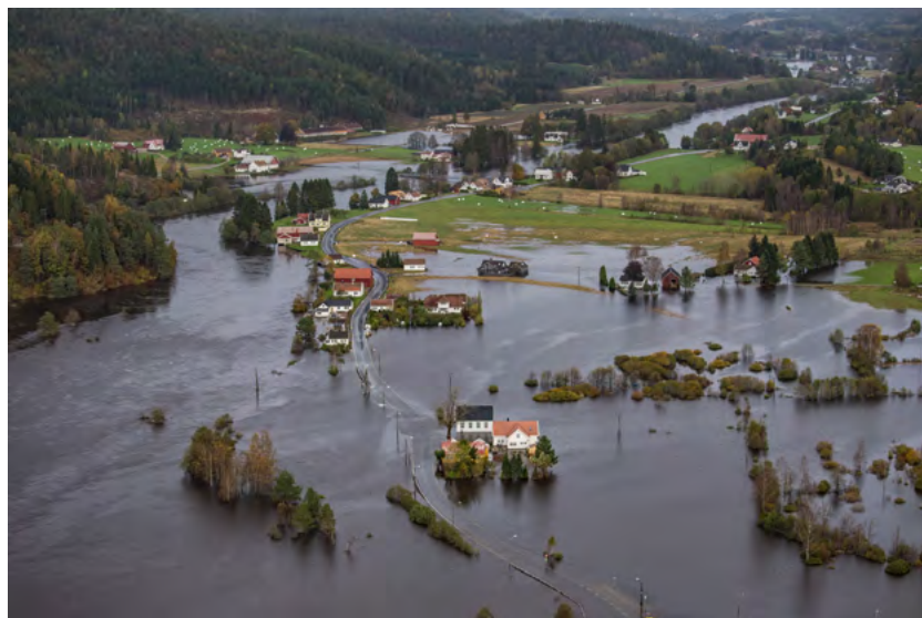
Figur 19: Drangsholt er et boligområde i Kristiansand kommune som blir sterkt berørt når Tovdalselva flommer over.

men, og lokalbefolkningen foretok egen nødvendig evakuering. En viktig lærdom fra episoden var at bygda ved velforeningen ønsket å samarbeide med kommunene om bl.a. en varslings- og oppfølgingsberedskap. Dette er formalisert i en samarbeidsavtale mellom velforeningen og Kristiansand kommune, og fem beboere i bygda vil bli varslet direkte fra kommunens beredskapssjef dersom oransje farevarsel med fare for rød og en storflomsituasjon oppstår.