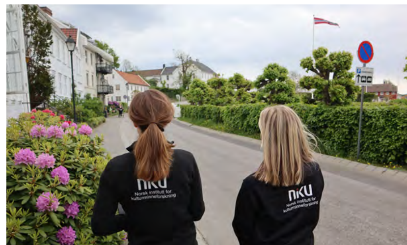
Figur 1: Befaring i Lillesand.

Mange gjør allerede et godt arbeid når det gjelder ivaretagelse av kulturminner og beredskap for ekstremhendelser, og har planer, rutiner og nettverk som fungerer godt. Vi håper likevel at denne veilederen også er nyttig for dere, og at den kan gi inspirasjon til å øke fokus på beredskap for historiske bygninger.