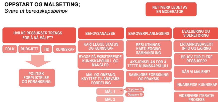
Figur 9: Rammeverk for systematisk nettverksbygging, inspirert av «bakoverplanlegging» og gjennomføring av øvelser. Figur: Flyen/Jernæs (2023), NIKU.

og ressurser er ofte avhengig av politisk satsing på området.