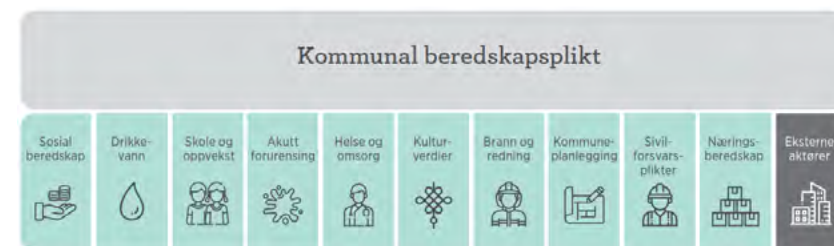
Figur 2: Oversikten fra DSB viser inkludering av kulturverdier i kommunenes arbeid med Helhetlig ROS. Grafikk: Veileder til helhetlig risiko- og sårbarhetsanalyse i kommunen, DSB 2022, s. 9.