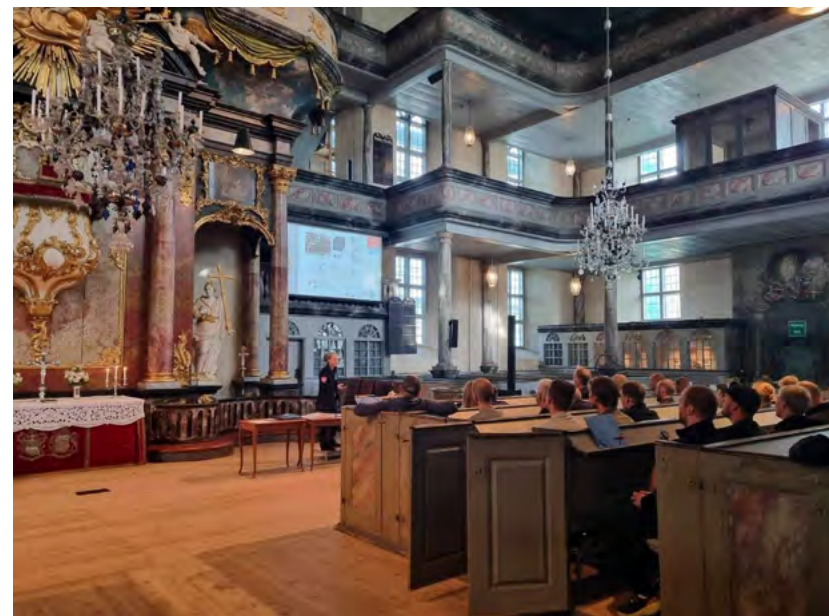
Figur 25: Representanter for Bergen brannvesen og Oslo brann og redningsetat holder jevnlig kurs for RVR-ledere i verdiberging og restverdiredning av objekter med kulturhistorisk verdi. Foto: Anne Bjørke, Bergen brannvesen; RVR-kurs i Kongsberg kirke.