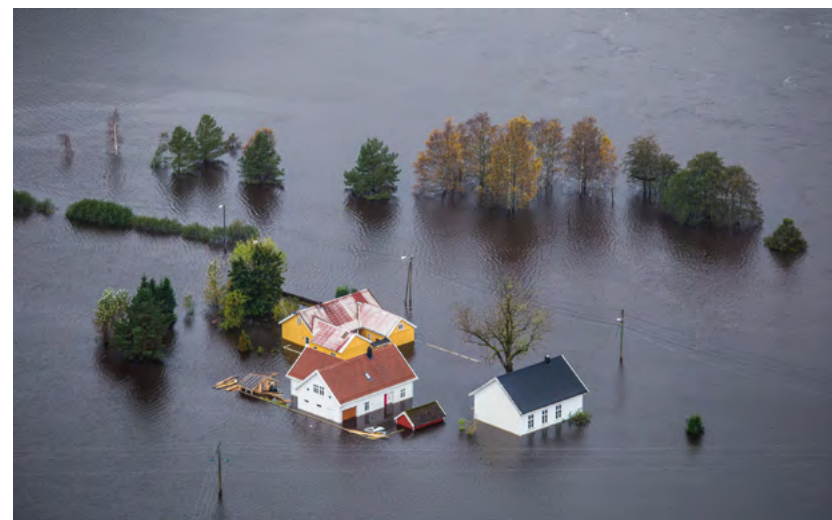
Figur 20: Bildet er tatt under høstflommen i Tovdalselva i 2017.

Fylkeskommunen, ved bygningsvernssenteret, tok initiativ til skanning av de tre bygningene som var skadet etter brannen, og før gravemaskin ble benyttet for ryddig av branntomten. I prosessen samarbeidet fylkeskommunen og kommunen. 12. mars samme år ble gjenstående fasader mot gatene skannet. Hensikten var å doku-