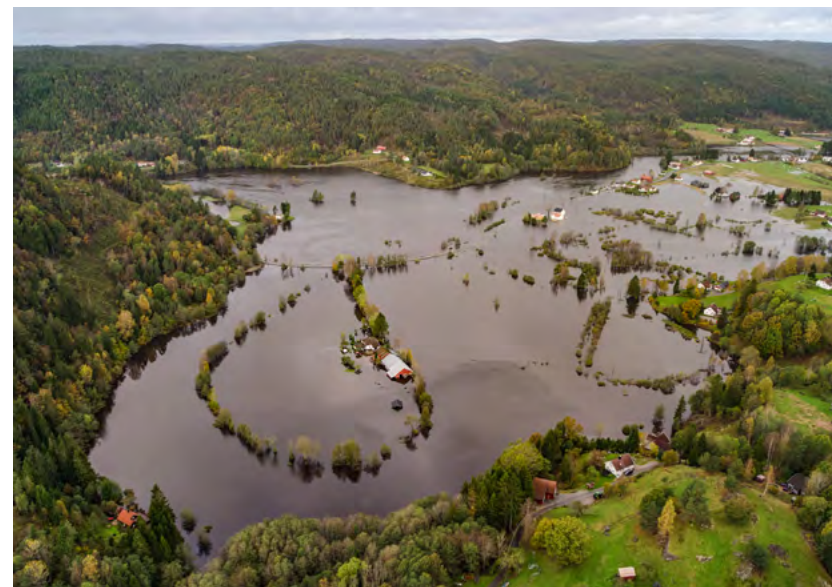
Figur 5: Drangsholt er et boligområde i Kristiansand kommune, som ble sterkt berørt under høstflommen i 2017. En engasjert velforening samarbeider nå med kommunen om varslings- og oppfølgingsberedskap i bygda. Les mer om dette i kapittel 9.

Du kan lese mer om samhandling og øvelser i kapittel 8.