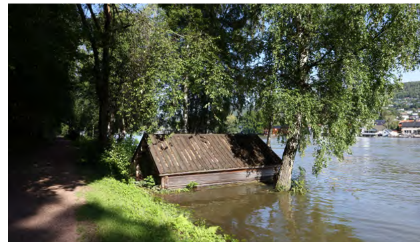
Figur 10: Drammensvassdraget etter uværet "Hans" i august 2023.

Et nettverksarbeid strukturert etter bakoverplanlegging går ut på at man starter med et helt konkret mål, enten det er å skape en beredskapsplan eller styrke seg på beredskap innen spesifikke områder. Med dette utgangspunktet, planlegger man ut fra et ideelt slutt punkt og kartlegger alle nødvendige beslutningsprosesser og aksjoner underveis i prosjektet fra begynnelse til slutt.