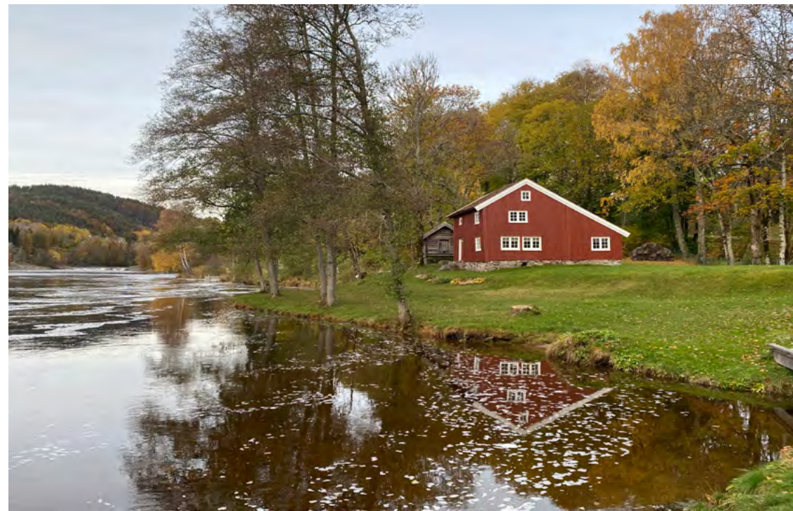
Figur 6: Knarestad på Tveit i Kristiansand ligger langs elveleiet ved Tovdalselva og har blitt oversvømt flere ganger.

Det bør også etterstrebes at fylkesmuseer og fylkesarkiv, samt prioriterte verneverdige bygninger (som et minimum) har verdibergingsplaner etter nasjonal standard 3 .