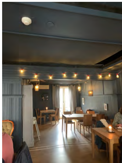
Figur 17: Detektor i himling, kafelokale i Gamlebyen.

Brannalarmanlegget gjør det mulig å oppdage og handle tidlig ved brann. Dermed kan konsekvensen av brann begrenses betydelig.