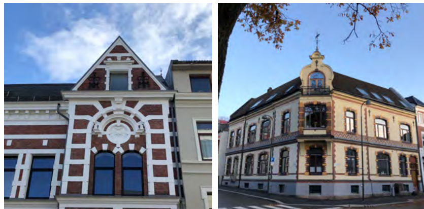
Figur 15: Kristiansand kommuner har mange murgårder der brannvesenet går tilsyn, med hjemmel i lokal forskrift.

Forskriften finner du her: Agder Forskrift om tilsyn i bygninger, Kristiansand kommune, Agder - Lovdata