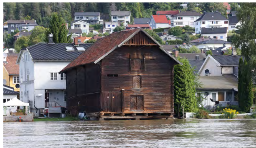
Figur 4: Drammensvassdraget etter uværet "Hans" i august 2023.

I kommuner der det ikke er en dedikert stilling til å arbeide med kulturminner og kulturmiljø, vil det være hensiktsmessig å utnevne en ansatt som kan ha regelmessig kontakt med kulturminneforvaltningen i fylkeskommunen. Det er ulik kompetanse på de ulike forvaltningsnivåene som kan virke