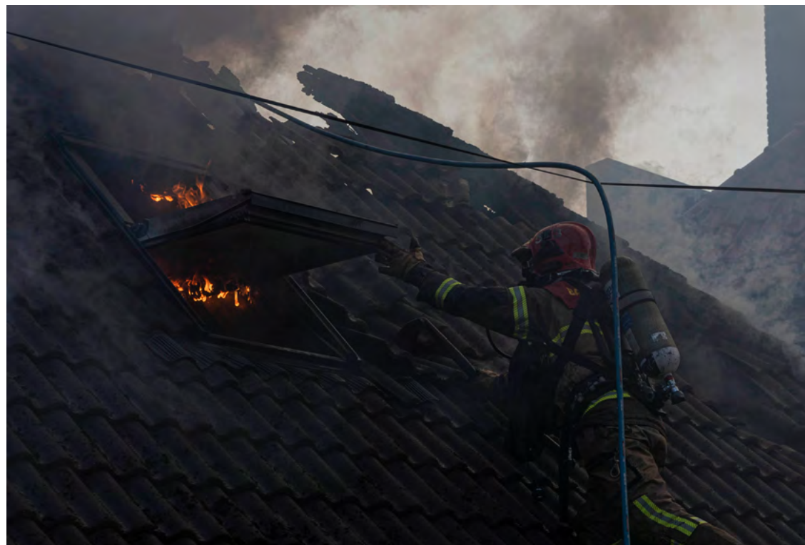
Figur 31: Brannen i Bergen sentrum oktober 2023.

ResCult The Increasing Resilience of Cultural Heritage project: https://www.undrr.org/news/preserving-heritage-boosts-disaster-resilience