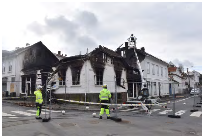
Figur 21: Skadde bygningsfasader etter brannen i Risør.

Potensialet ved bruken av dette materialet var stort. Fylkeskommunen påpeker at skanningen var nyttig, men dokumentasjonen nok kunne ha vært utnyttet enda bedre. Siden ingen av bygningene var fredet, ble bruken av dokumentasjonen noe begrenset. Dette hadde trolig vært annerledes dersom fylkeskommunen hadde fått gjennomslag for en autentisk tilbakeføring, bl. a. i forhold til konstruksjon. Konklusjonen fra fylkeskommunens side er at skanning er et nyttig hjelpemiddel på veien, men at det store arbeidet ligger i å få opplysningene brukt og overført videre i byggeprosessen.