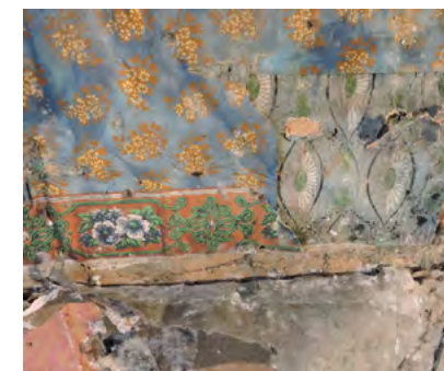
Figur 28: Håndtrykte tapeter fra ca. 1785 og 1805. Border i seks fargetrykk fra 1. etasje sør-øst.