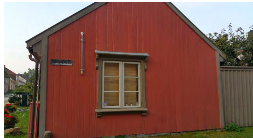
Figur 16: Tørrørsanlegg, med påkoblingsdel for brannvesenet.

Systemet varslet i utgangspunktet hele kvartalet dersom alarmen ble utløst. Etter revurdering ble anlegget omprogrammert til å kun varsle i den aktuelle bygningen og direkte til 110-sentralen. Det er ikke ansvar eller kostnader