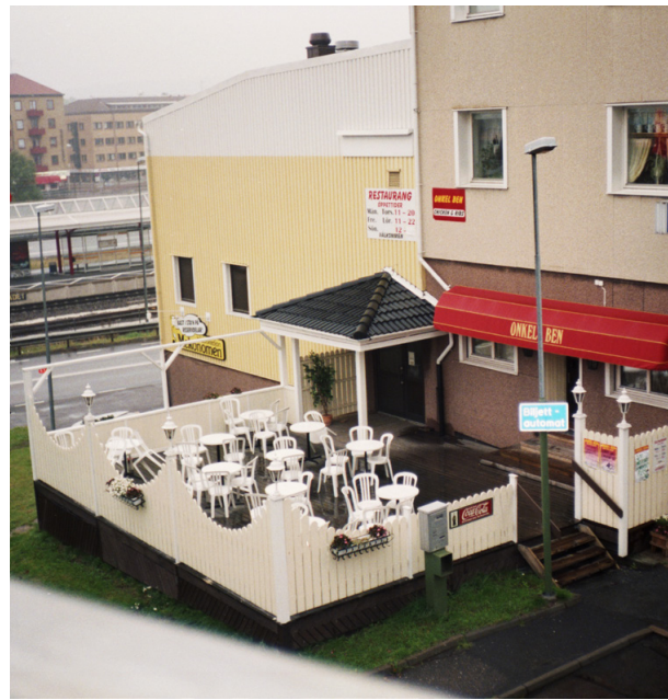
En del av restaurangerna från då finns kvar... andra inte.