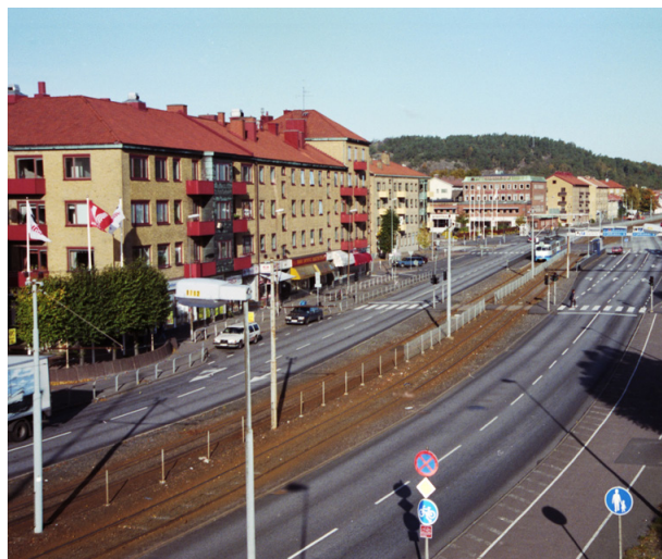
Så här såg det ut där spårvagnshållplatserna ligger i dag.