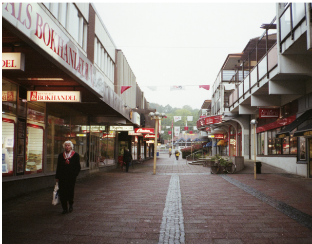
Det har skett en rejäl förvandling av Mölndals centrum sedan 90-talet.