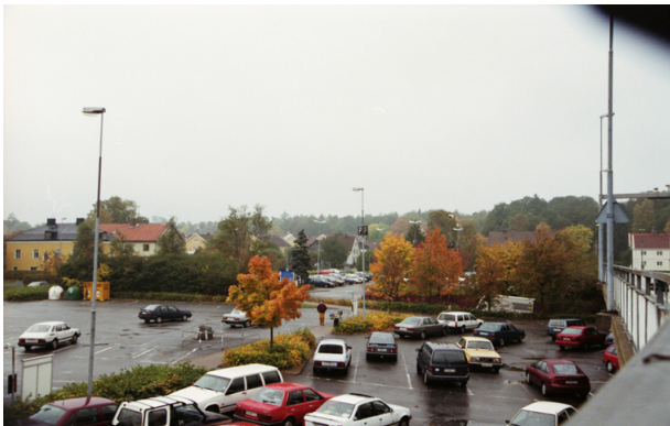
Bilder från Mölndals centrum, tagna 1996.