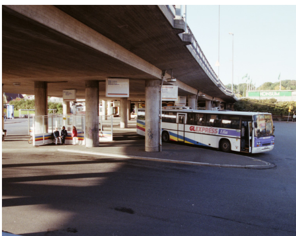
Även bussarna såg annorlunda ut, och de stannade under Mölndals bro.