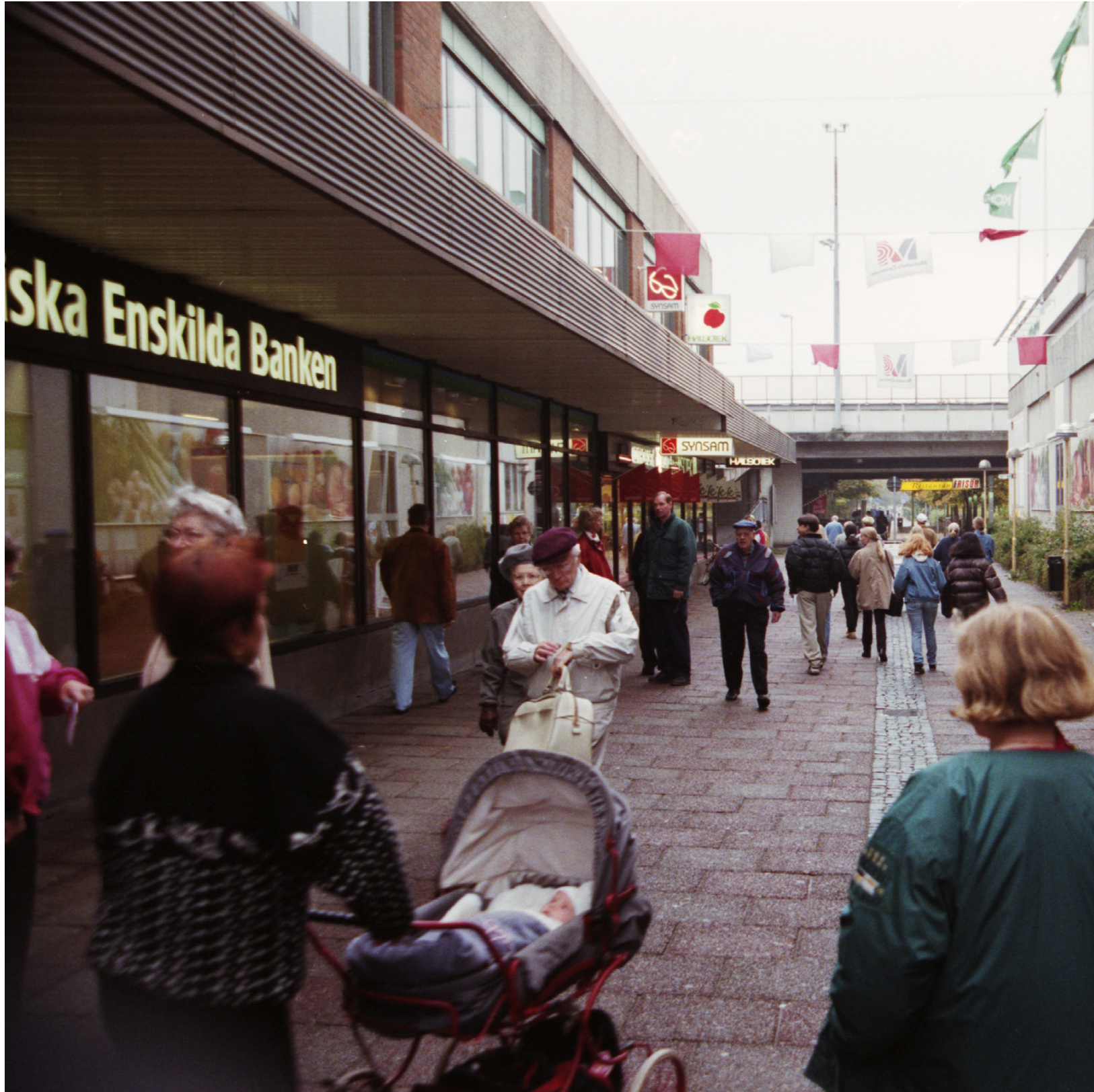
En vanlig vardag i Mölndal 1996.