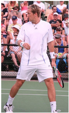
Jonas Björkman fyller år i dag. Här när det begav sig under tenniskarriären, i Australian Open 2007.