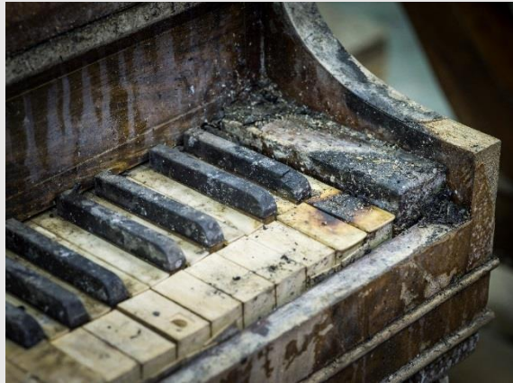
Brann- og varmeskader