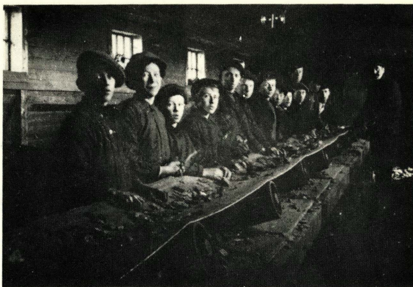
Plukkhusryss i arbeid ca. 1912