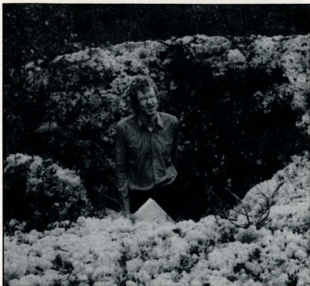
Rune på 1,95 m. Enkelte av gravene er imponerende store, ned til 2,5 m. djup og 6-7 m. tvers over målt fra toppen av vollen. Vollen er gjerne rikt dekorert med reinlav.