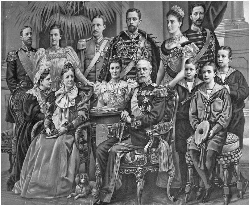
Kong Oscar II i spissen for den kongelige familie, 1905