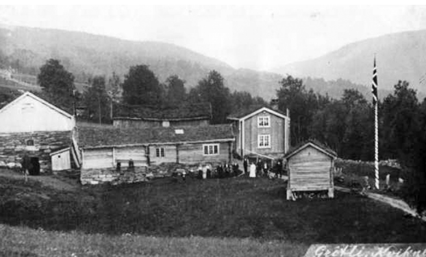
Grøtlihaugen, Kvikne, med spiralmalt flaggstang

Henvendelser til sentrale museer og universitet har så langt ikke gitt et eneste utslag. Ved Historisk institutt ved Universitetet i Oslo er det flere som arbeider med 1905 og dermed også flagget. I den sammenheng er historikeren Halvdan Kohts notater om flagg, på ca 500 lapper, gjennomgått, men ingen spor etter noe tilsvarende. Det samme er svaret fra andre universitet og ikke minst museer med store fotosamlinger. Noe liknende har de ikke sett: