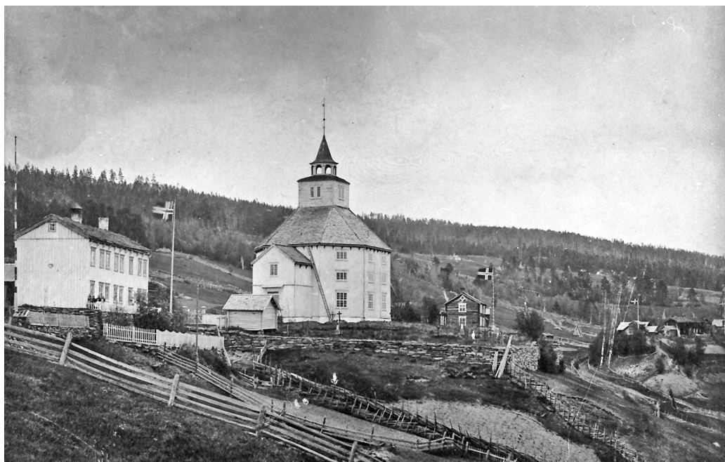
Flaggdemonstrasjon, ant. 17. mai 1896. Et bilde med mer flagghistorie finnes knapt

folk som har tatt oppstilling. Det var nok slik at skulle det fotograferes, skulle det også flagges.