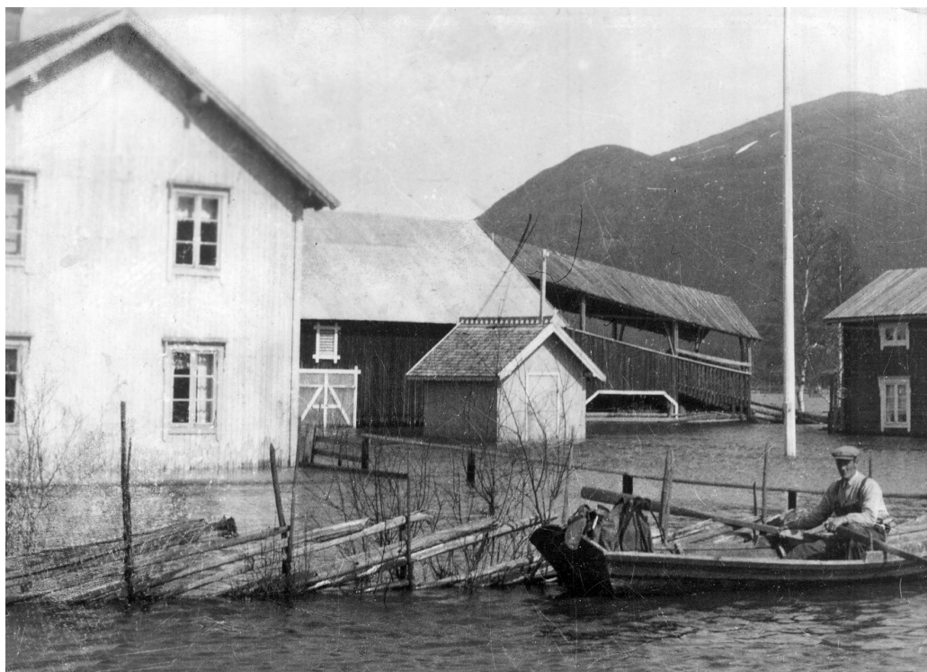
Fra flommen i 1934.

Ettan og drakk surmelk pisket opp med kaldvatten. Han kastet aldri skjorta, brettet kun til nød opp skjorteermene, stappet staur og la tråd mens vi ristet opp graset og la det på hesjestrengen. Høygaffel var bannlyst.