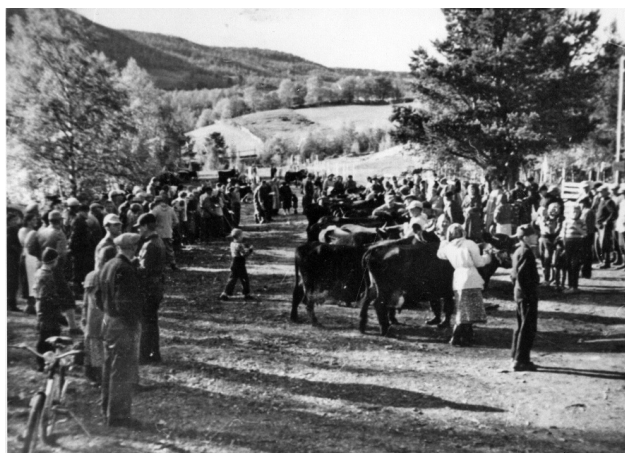
Utstillinga på Moan i Vingelen 21. september 1956, der det ble framstilt ei avkomstgruppe etter Lykkreison og hvor oksen fikk første avkomstpremie. Fesjåa var et fargerikt innslag i bygdelivet.

Avslaget for dølafe i Gudbrandsdalen var i 1951 interessert i å kjøpe Lykkreison for å bruke den som seminokse på oksestasjonen Brattland i Fåberg, men laget bestemte seg for å beholde oksen da det ville være vanskelig å finne en erstatting. Laget fikk ei ny henvendelse i 1954, og nå ble det vedtatt å selge den for kr 3000.