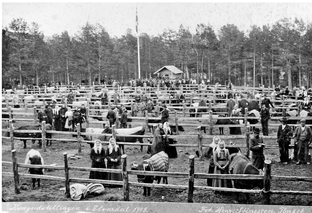
Kvægudstillingen i Elvårdal 1905.