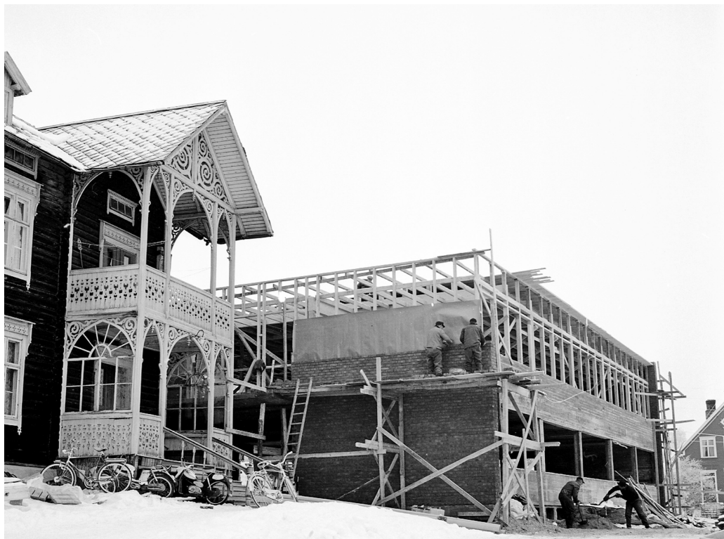
Fra byggingen av kommunehuset Nyborg, Alvdal. 1968.