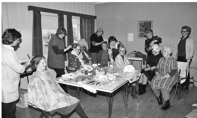
Frisørstue i Vingelen. 1978.