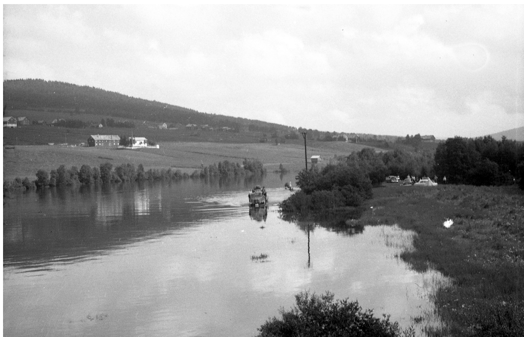
Flom på Tynset camping, 1957.