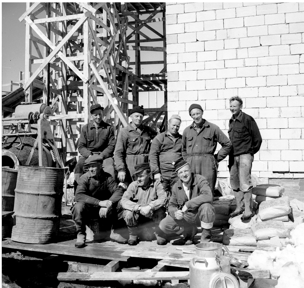
Fra byggingen av Os hotell, 1960.