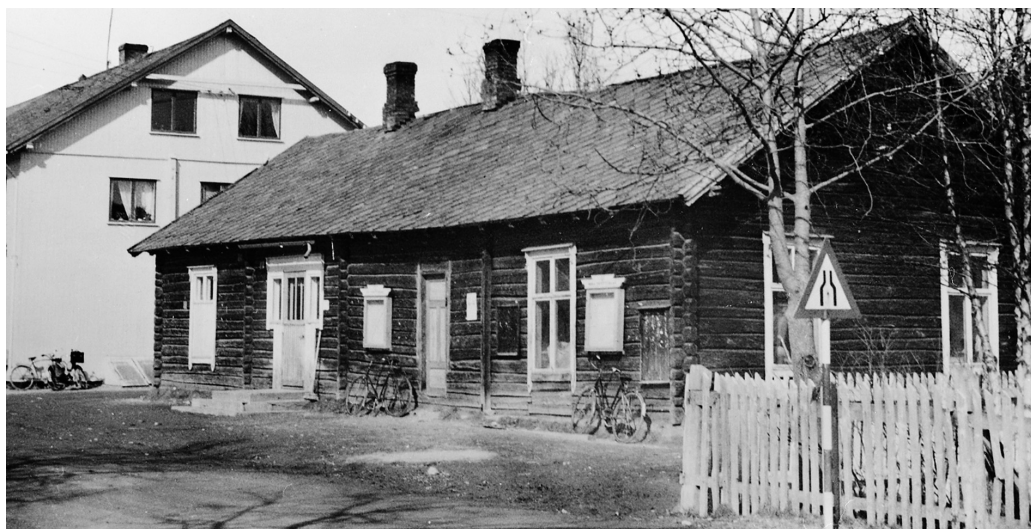
Gamle forsamlingshuset Fram i Os.