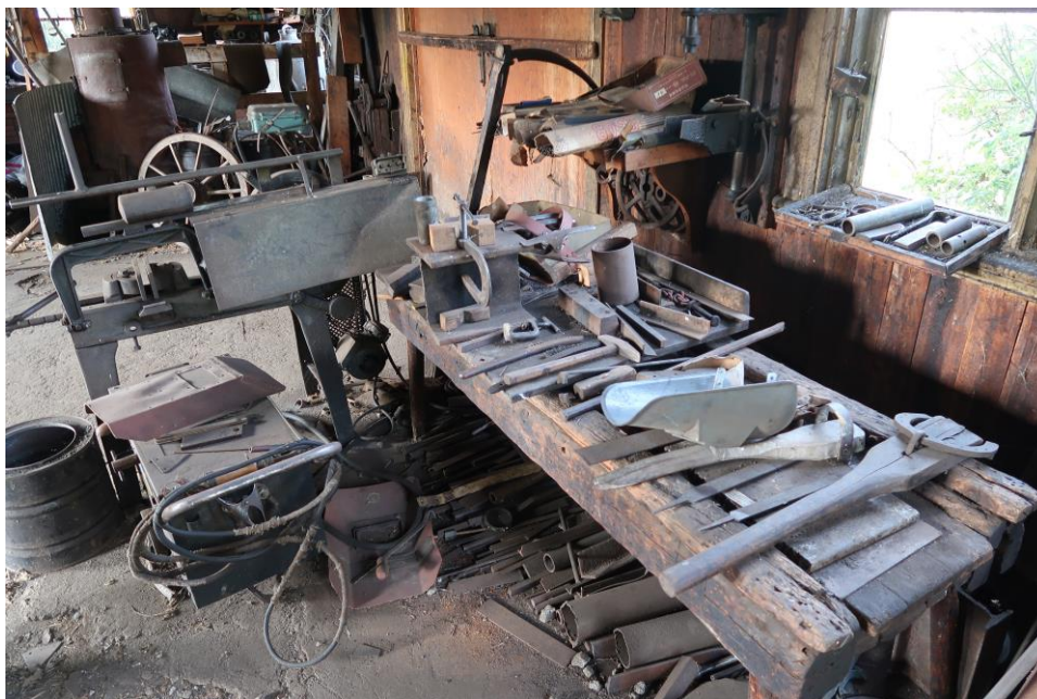
Verktogsbänk i den mekaniska verkstaden/smedjan på nedervåningen.

År 2007 genomfördes en del arbeten på byggnaden med stöd av bidrag från Länsstyrelsen samt antikvarisk medverkande från Örebro läns museum följde arbetena. Då röjdes en del sly invid byggnadens fasader, fönstren renoverades och målades i en ljus gul kulör. Samma kulör användes till panelen i takfoten samt knutbrädor. Portarna målades i en rödbrun kulör och fasaderna avfärgades med falurödfärg. I samband med dessa arbeten ersattes häng- och stuprör på framsidan av byggnaden. Det förordades att galvaniserade delar skulle användas för att de sedan skulle målas vita. Färdiglackerade vita monterades.