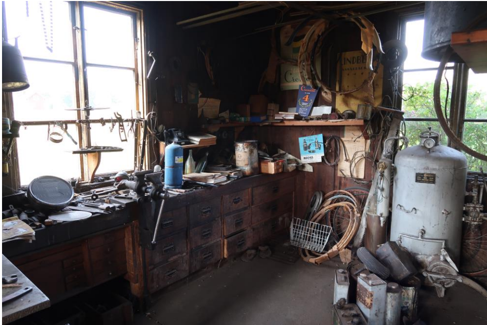
Del av mekaniska verkstaden på nedervåningen. Här fanns bland annat en gassvets.

och interiörer har sedan dess stått i stort orörda.