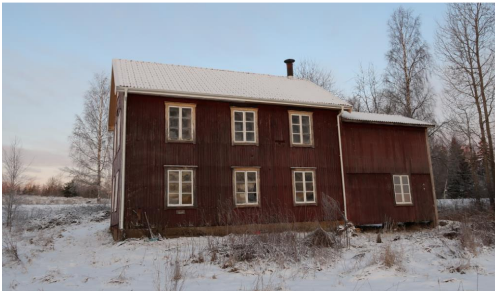
Baksidan av smedjan, efter åtgärder.

Vid slutbesiktningen var en del måleriarbete kvar vilket vädret inte tillät då det blivit för kallt. De nya delarna var endast grundmålade med obruten vit linoljefärg (Engwall o Claesson). Fastighetsägaren har för avsikt att måla det resterande under 2020, då vädret så tillåter. Vindskivor, foder samt panel i takfoten kommer att målas med vit linoljefärg för att återgå till den tidigare färgsättningen.