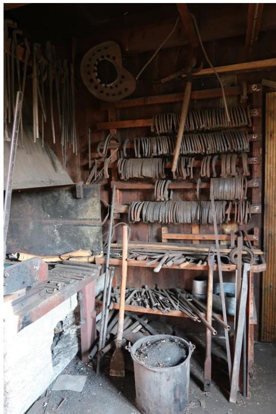
Del av smedjan och ässjan, på nedre våningen. På väggen hänger bland annat många hästskor då de också skodde om hästar.

I dag finns fortfarande utrusningen och inredning kvar från verksamheten, vilket visar på den stora bredd av verksamhet som kunde bedrivas och som förr var vanligare i mindre samhällen. Allt från hårklippningsmaskin fortfarande på plats i sin specifika låda, hästskor, mönster och förlagor till möbler till remdrivna maskiner, elsvetsar, ässjor, smörjgrop mm.