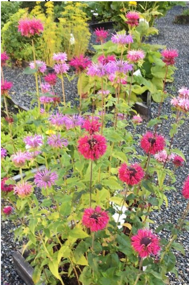
Flott blomstring i Apotekhagen

Hagegruppa hadde også i år hovedansvaret for Apotekhagen, og vi fikk en fantastisk blomstring her. Vi arbeider kontinuerlig med videreutvikling og prøver ut nye vekster, noen lykkes vi med, andre ikke. Dessverre lyktes vi ikke med mariatistel og benediktinertistel i år, men solblom – arnica montana – kom igjen. Håper den og de andre urtene klarer brasene gjennom denne vinteren også.