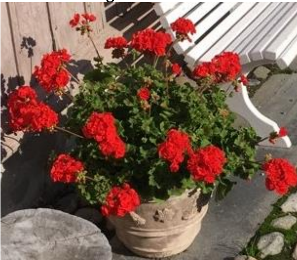
Krukke med geranium i fullt flor

Venneforeningen har også ansvaret for alle blomsterbed og krukker på hele det store området. Vi har gjennom mange år kjøpt inn store og tidsriktige krukker som vi har hegnet godt om. Dessverre tok frosten to av våre krukker i «Godværs kaféen» i høst. Vi sørger for å fylle krukkene med sommerblomster hver vår.