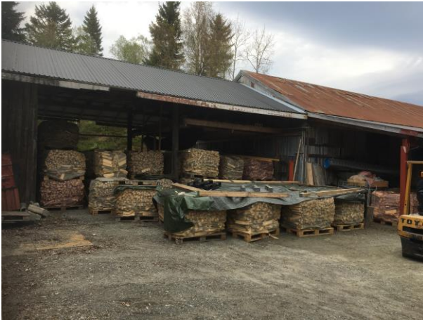
Ved fra Dyrborgskogen