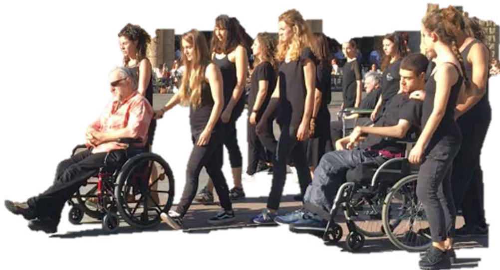
Dansegruppe på gata i Bologna. Deltakerne har ulike funksjonsvariasjoner.