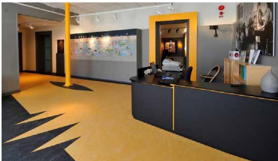
Norsk Døvemuseums resepsjonsområde. Her er kontrastfarger brukt gjennomgående i hele rommet og i utstillingene.

Ett eksempel er retningslinjene for bredde i passasjer, som er minst 150 cm. I praksis viser det seg at dette er for smalt for mer enn én person. I utstillinger vil vi gjerne ha mange mennesker, hele skoleklasser og båtlaste med turister. Og sitter noen i rullestol eller bruker rullator, eller om det skal tegnspråktolkes, så kreves det mer enn 150 cm. Da kan man i stedet for å lage små rom og avlukker, planlegge utstillingen i større åpne rom dersom det er mulig.