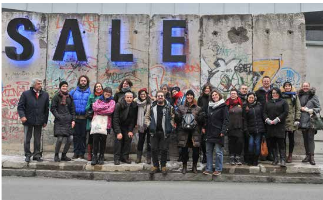
«... never walk alone...» Bildet viser deltakere i EU-prosjektet TANDEM, foran en bit av Berlinmuren utenfor Gråmølna, Trondheim Kunstmuseum