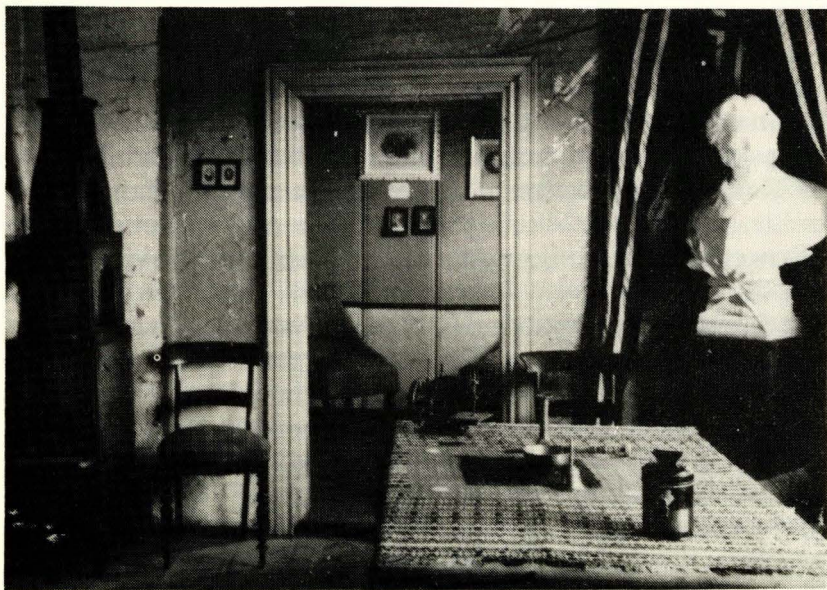
Stua i Bjørnsonbygningen. Bysta er laget av B. Bergslien og gitt til Bjørgan av Bjørnson.

Men Bjørnstjerne beundret sin far, bl.a. for hans styrke. Da