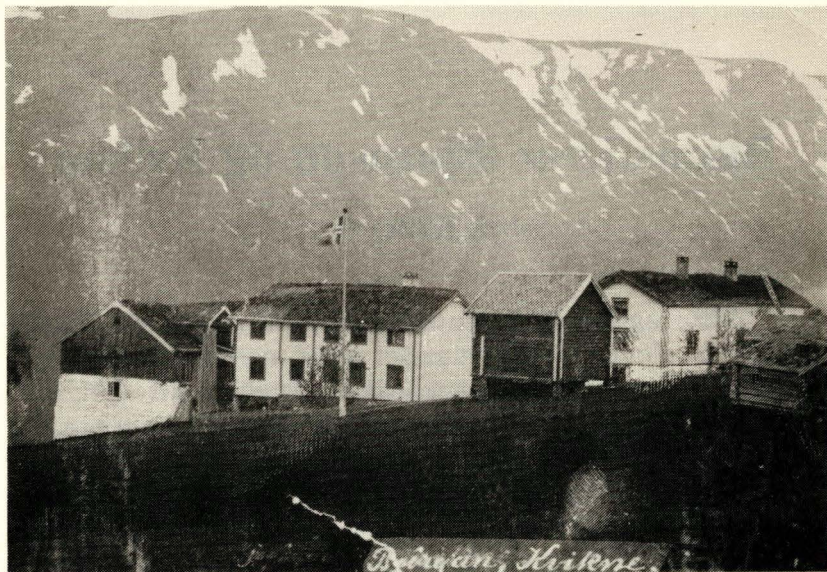
Bjørgan, Kvikne, med Bjørnsonbygningen midt i bildet, statsmuseum fra 1984