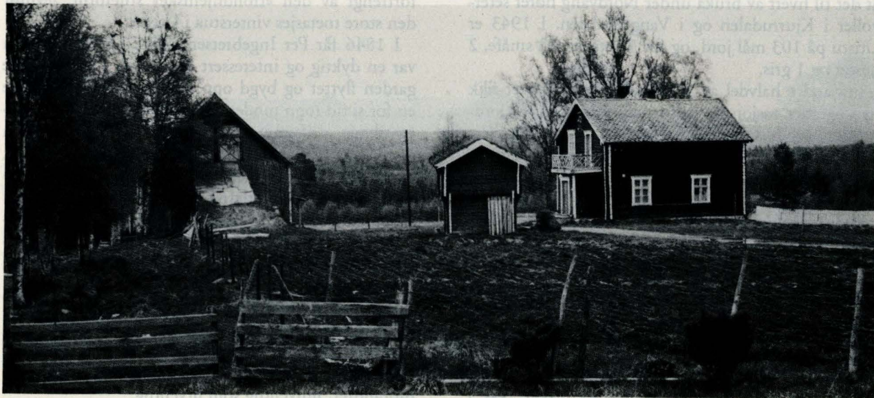
Røset i Vingelen, Tolga.