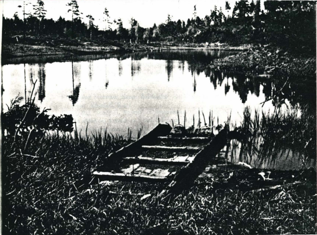
Stokkebåt bygget av 5 furustokker funnet under tapping av Fisketjern i Mykland i Aust-Agder, (nr. 733).

Fra Petter Megrund, Espedalen: 2 fiskegarn med hullfløtt og neversøkker.