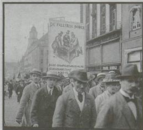
UROLIGE TIDER: Demonstrasjonstog under bankkrisen 1924. De harde 20-årene rammet vanlige folk hardt.

- Det var ikke matnød, men bønderne i Akershus ville ikke selge til hovedstaden. På den tiden ble varehandleren kontrollert av kommunen. Det var priskontroll på poteter og bønderne utenfor byen mente at fortjenesten var for liten. Derfor måtte det settes poteter innenfor bygrensen. Også Kongen måtte trå til og stille Slottsparken til disposisjon, forteller