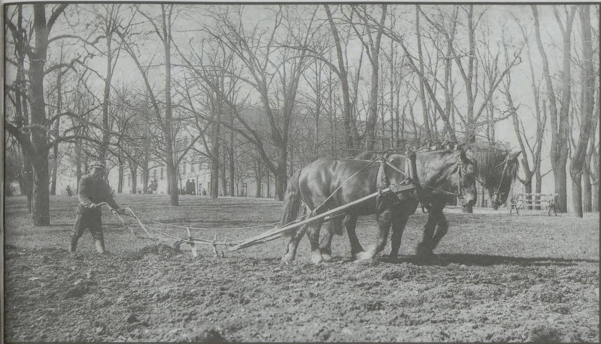
MATAUK: Potetdyrking i Slottsparken i 1917. Selv kongen måtte trå til. Fra boken «Kristiania for 100 år siden».