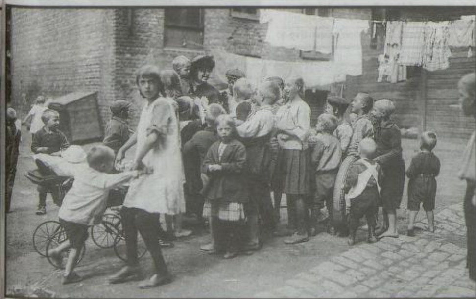
ØSTKANTEN: Unger fra gråbeingårdene på Østkanten i 1921.