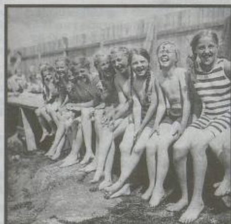
SOMMER: Jenter i solen på Verdens Gangs Solkoloni 1920.