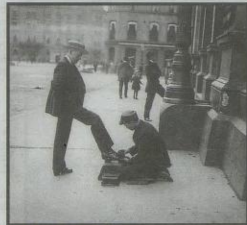
FATTIG OG RIK: En skopusser tjener til livets opphold ved Østbanen i 1916.

Dårlig hygiene, mangelfullt kosthold og underernæring gjorde arbeiderklassen mer utsatt for sykdom enn den bedrestilte befolkningen på Vestkanten. Tuberkulose var den