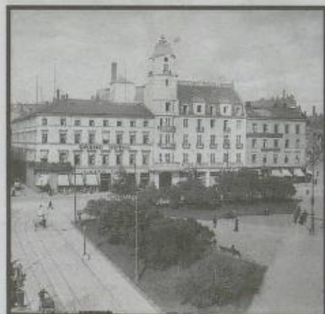
GRAND HOTEL: Grand Hotel og Eidsvolls plass 1912