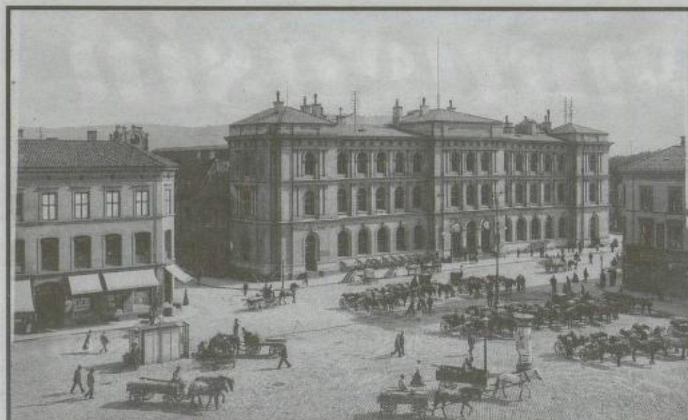
BY FOR HEST OG KJERRE: Østbanestasjonen og Jernbanetorget med hestedrosjer i 1910.