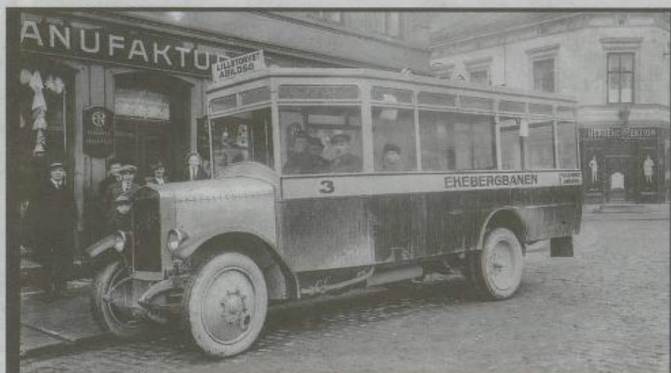
KOLLEKTIVT: Denne bussen gikk fra sentrum til Abildsø. Her fra Lilletorget i 1925.