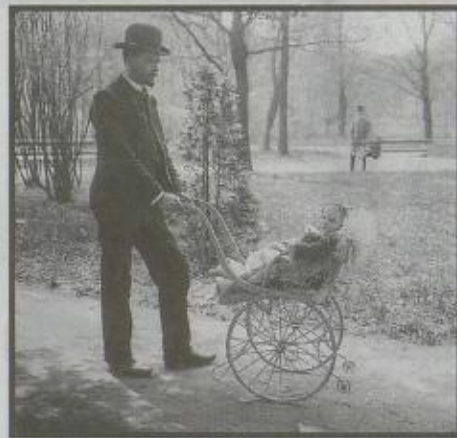
FREDELIG: Mann med barnevogn på Eidsvolls plass i 1905.