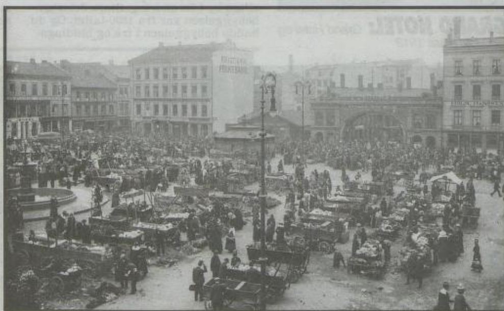
LIVLIG: Torghandel på Youngstorget i 1920.