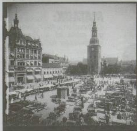
BYENS TORG: Slik så Stortorget ut i 1920.